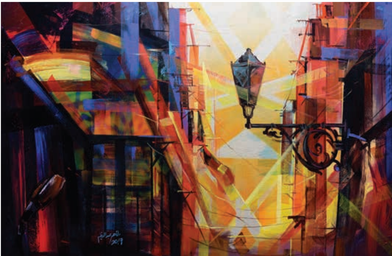
Oil painting 100 X 140