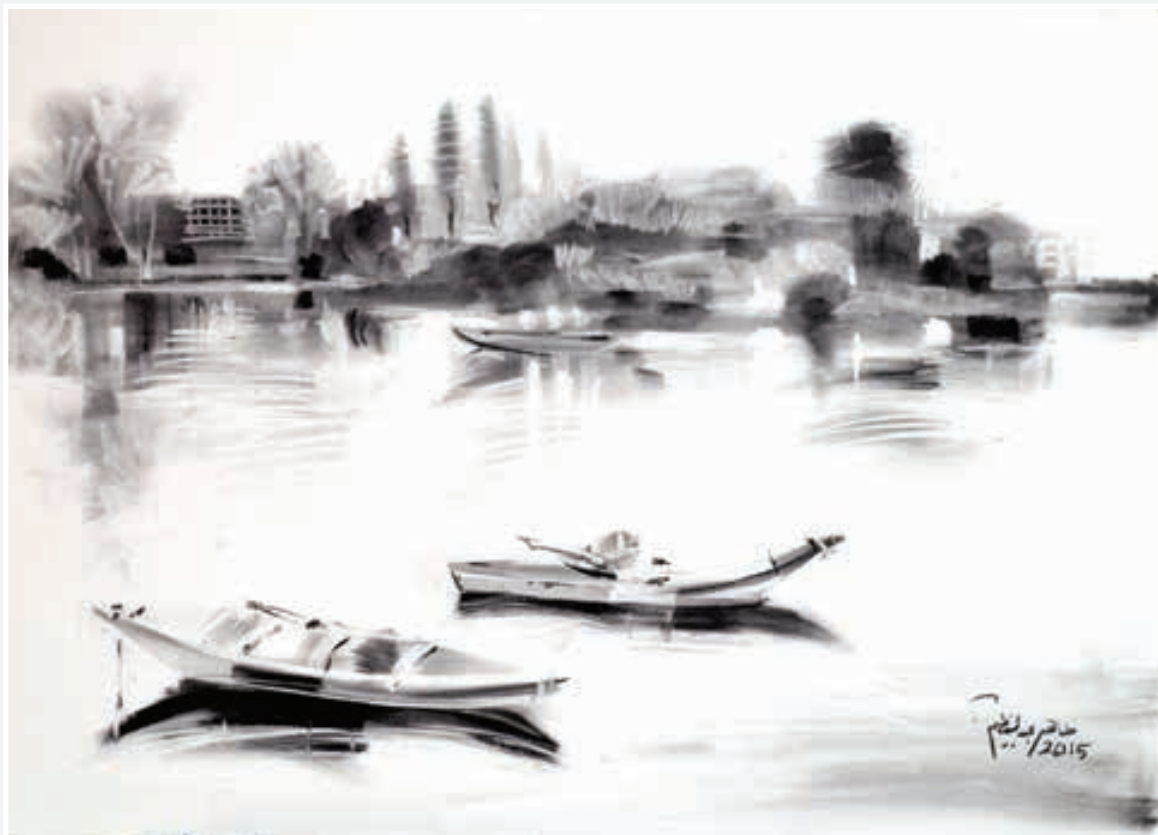
اسکتش فحم - 70 × 50