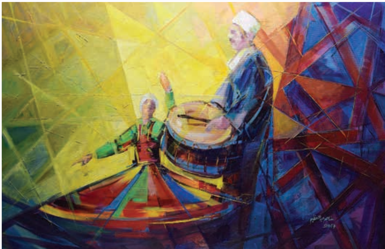
Oil painting 175 X 100