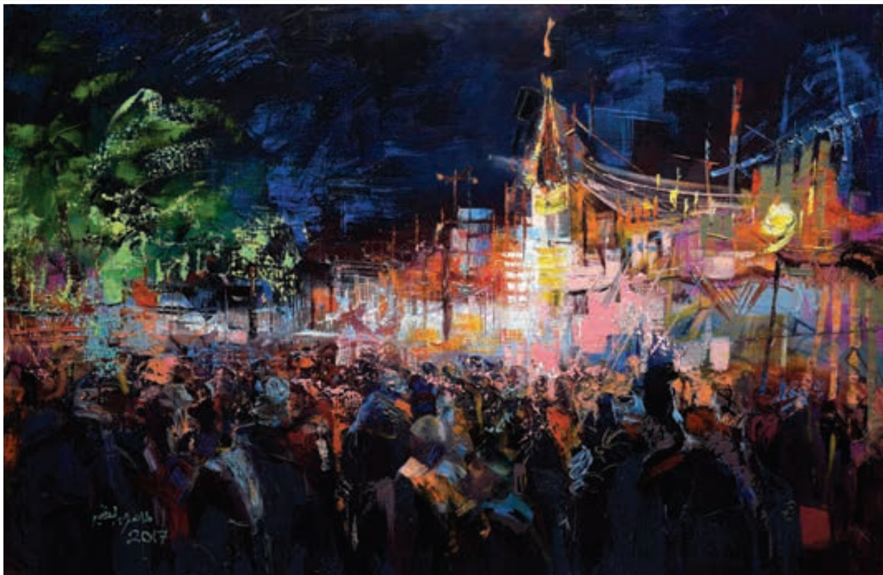
Oil painting 80 X 120