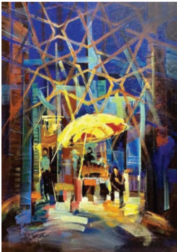
Oil painting 100 X 70