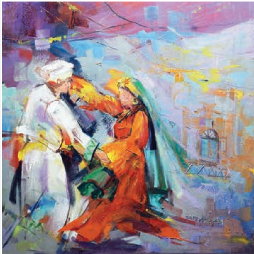
ألوان زيتية - 80 × 80 Oil painting - 80 X 80