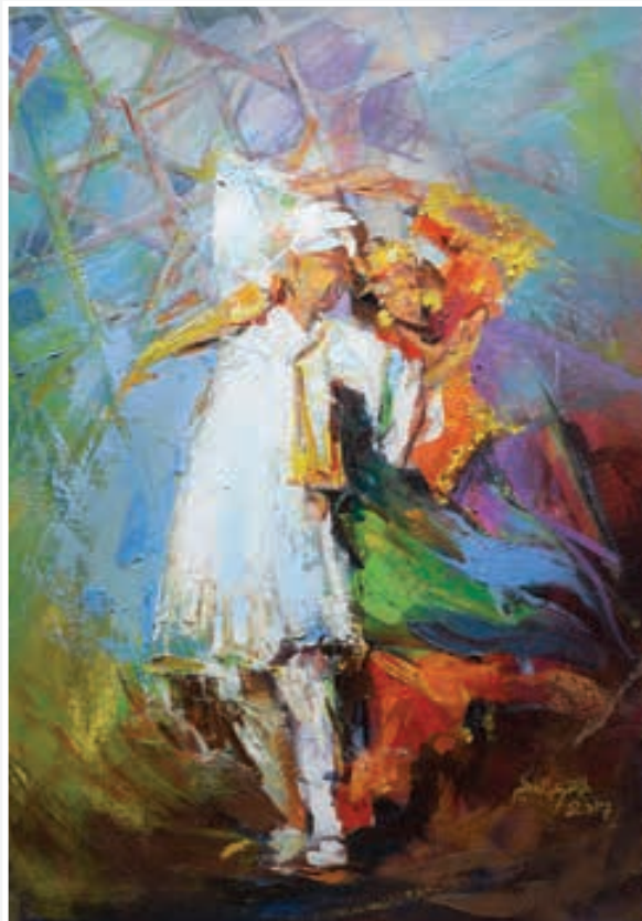
Oil painting 100 X 70