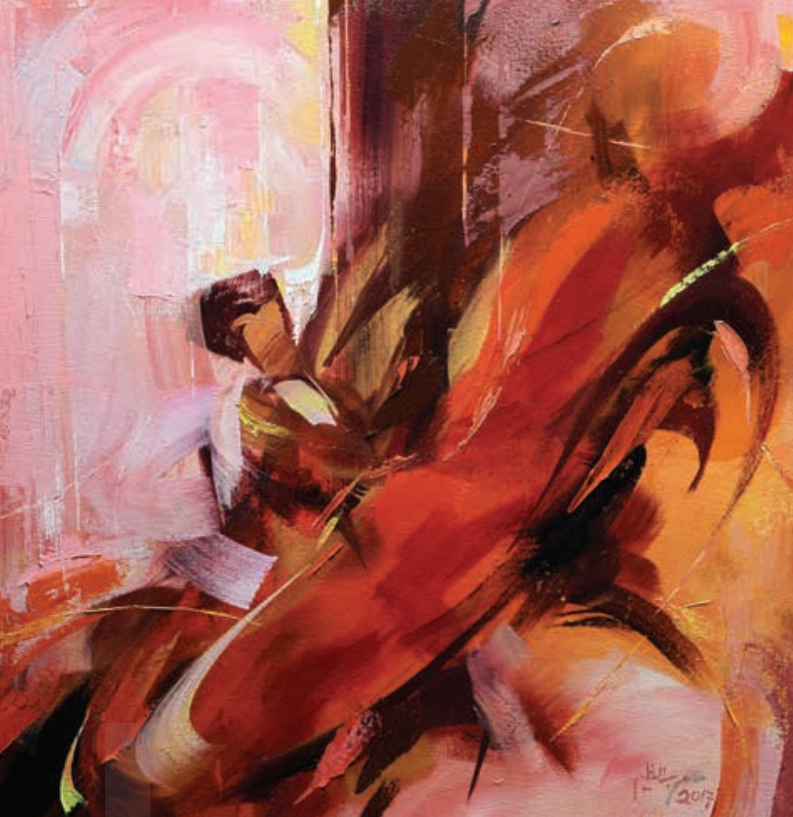
ألوان زيتية 70 × 70