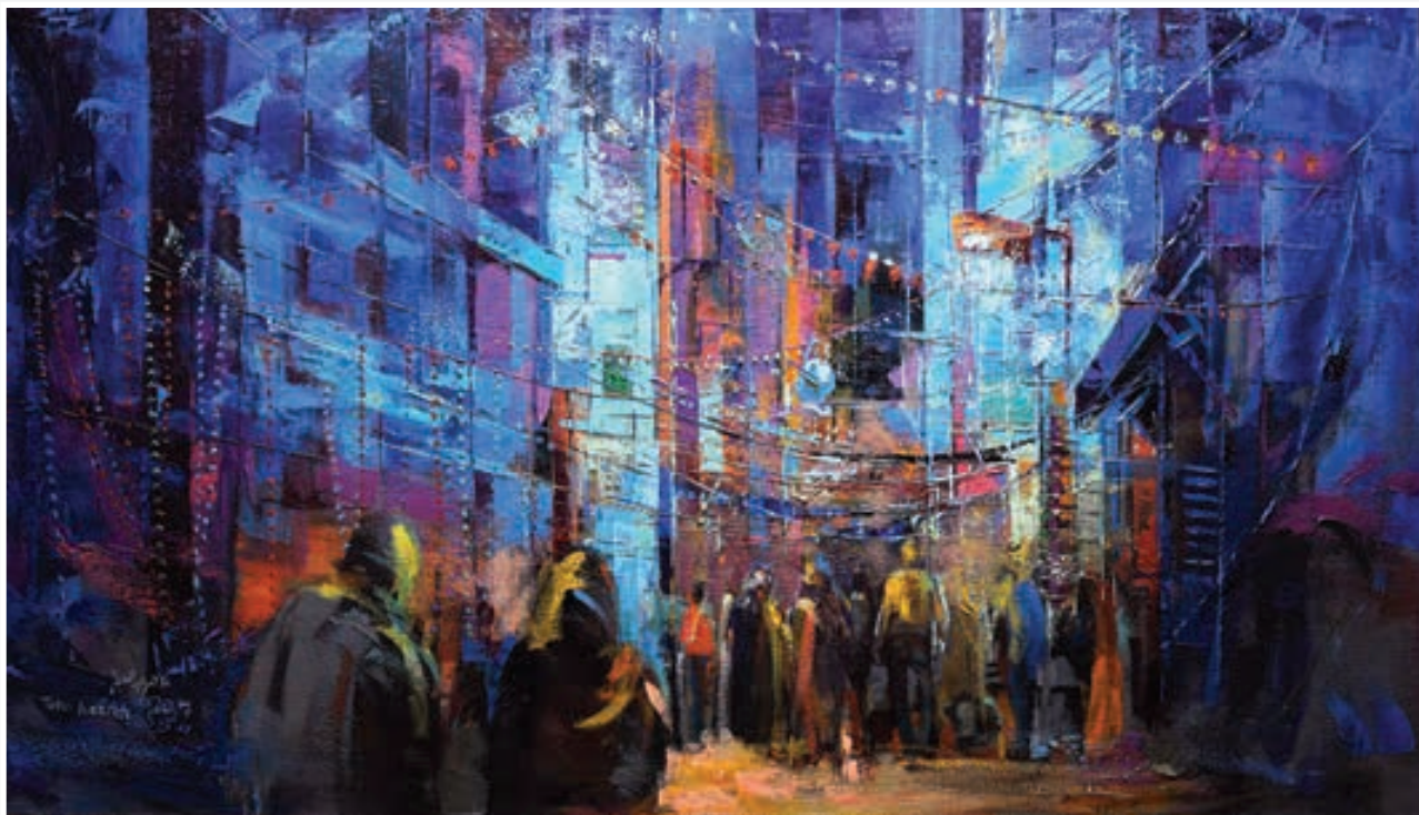
Oil painting 150 X 100