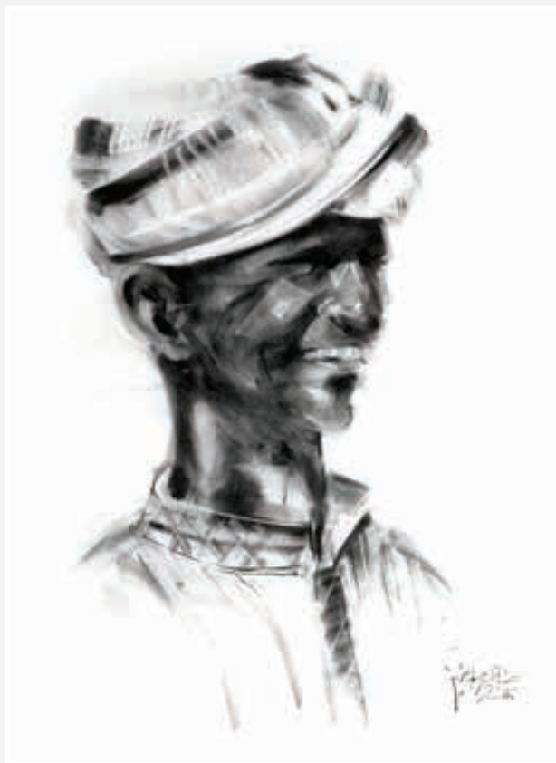
اسکتش فحم - 35 × 50