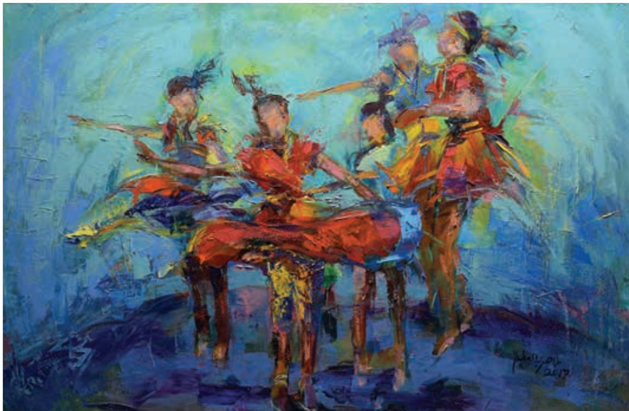
Oil painting 80 X 120