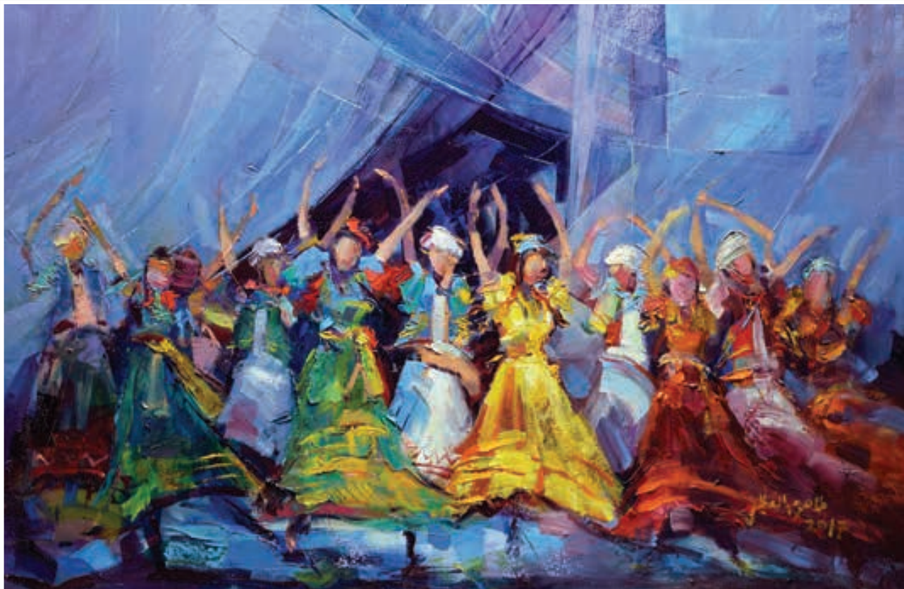
Oil painting 80 X 120