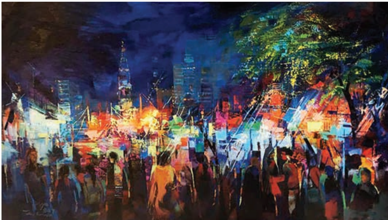
Oil painting 175 X 100