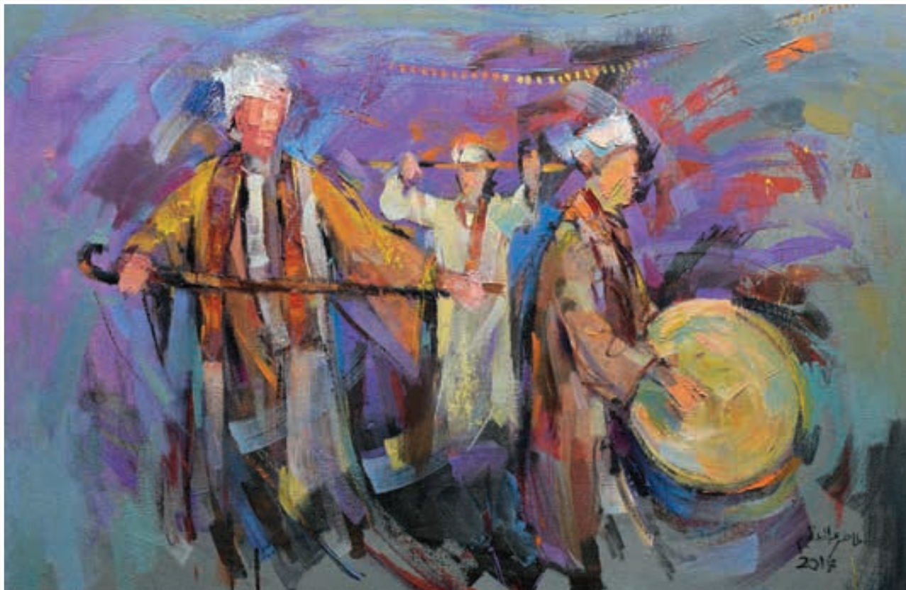
Oil painting 100 X 70