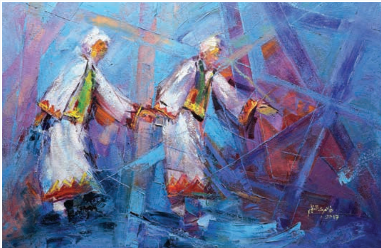
Oil painting 80 X 120