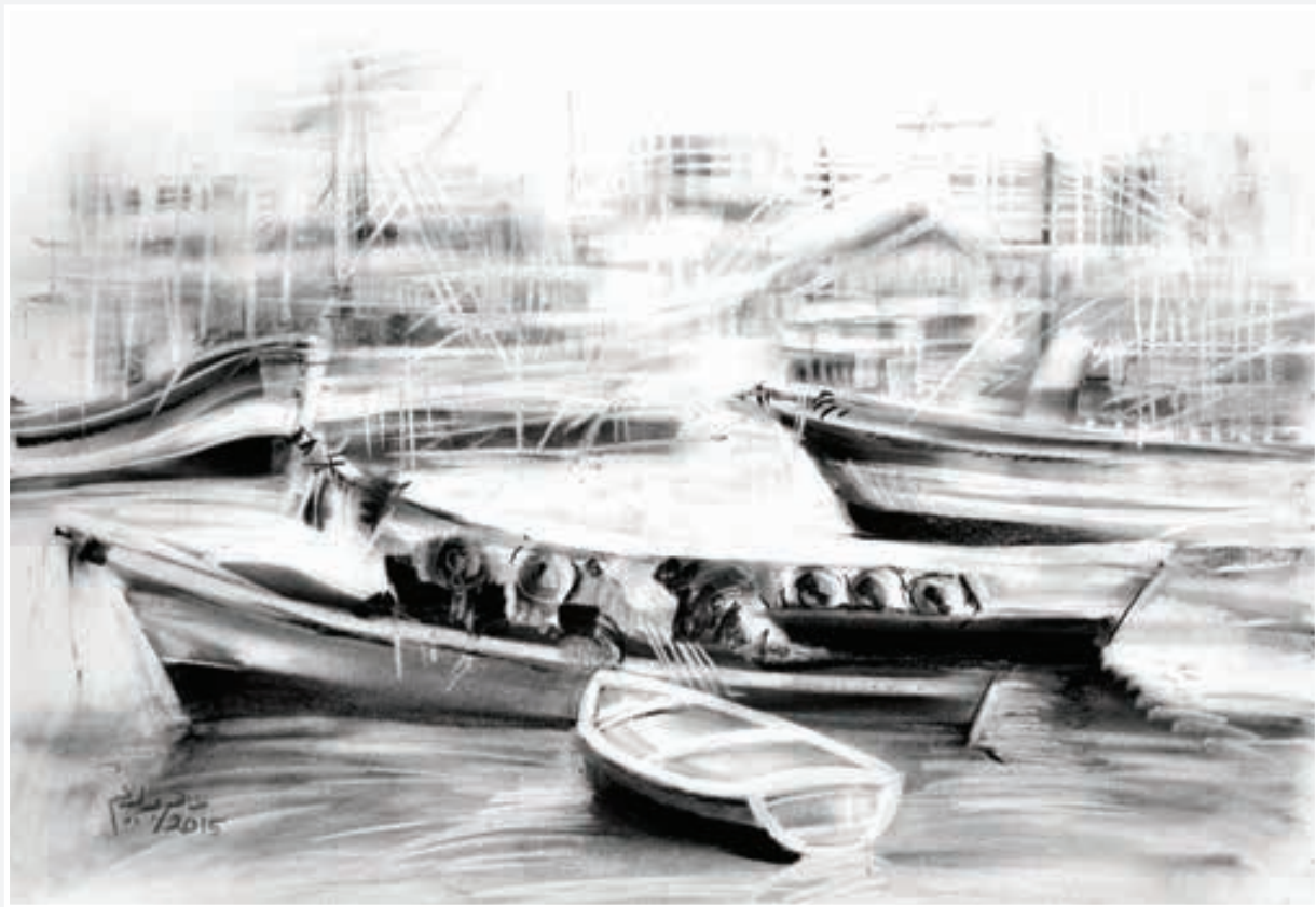
اسكتش فحم - 50 × 70