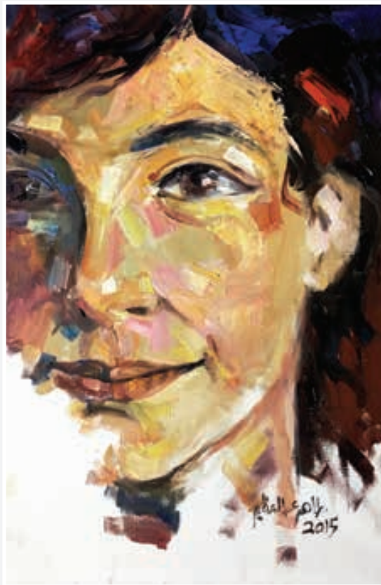
ألوان زيتية - 35 × 50