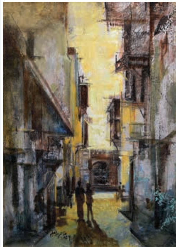
Oil painting 50 X 70