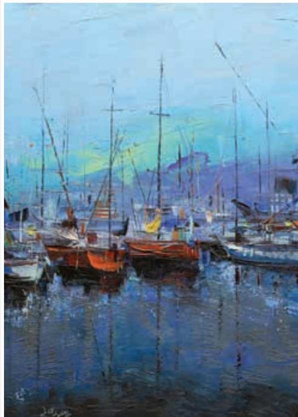
Oil painting - 70 X 120