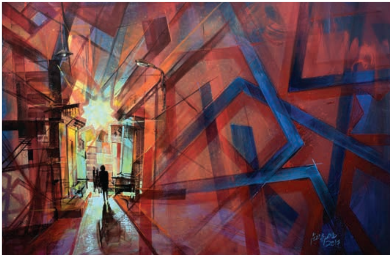
Oil painting 100 X 140