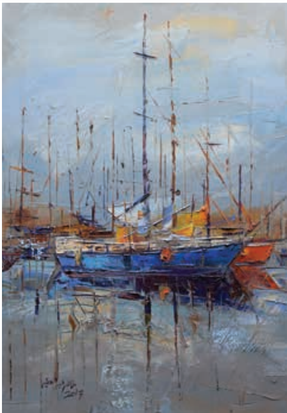
Oil painting - 50 X 35