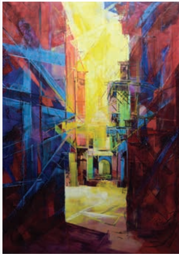
ألوان زيتية - 140 × 100 Oil painting 100 X 140