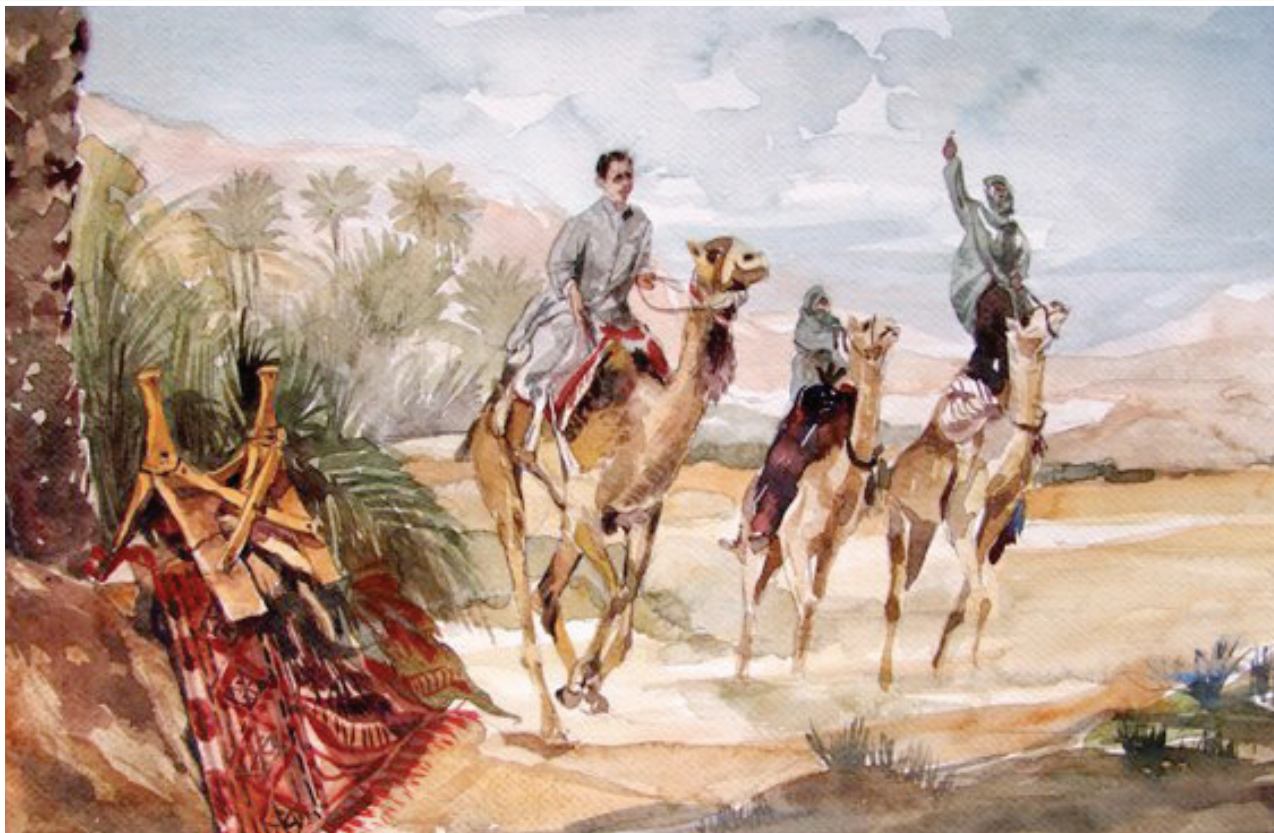
Water Color - 35 X 50