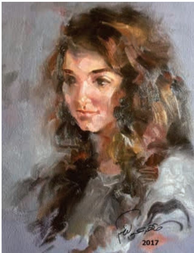
ألوان زيتية - 35 × 50