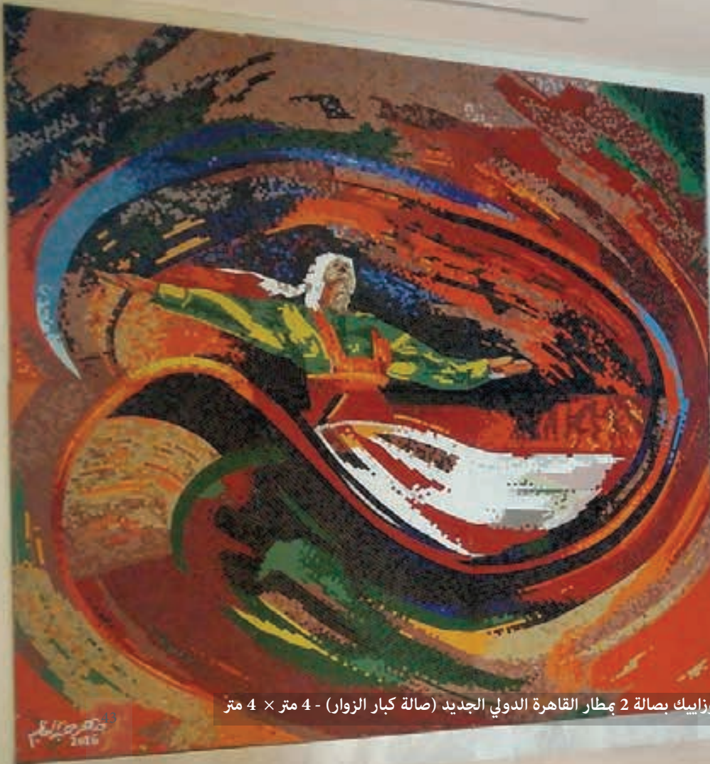
جدارية منفذة بخامة الموزاييك بصالة 2 مطار القاهرة الدولي الجديد (صالة كبار الزوار) - 4 متر × 4 متر