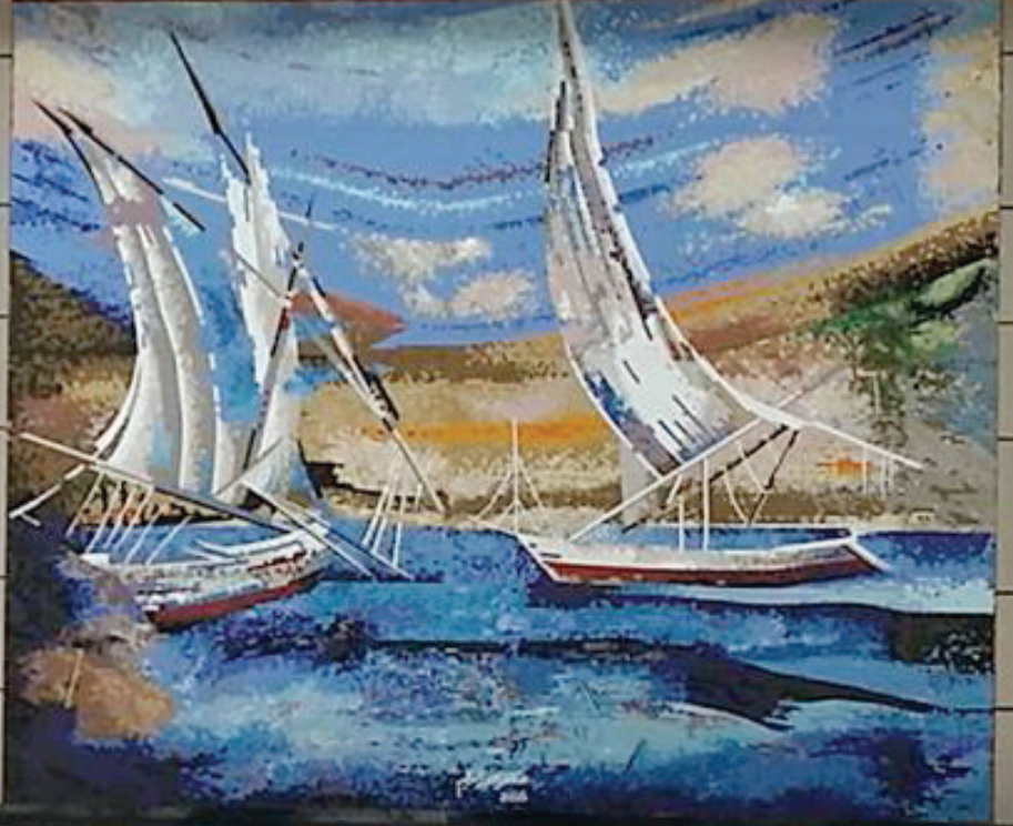
جدارية منفذة بخامة الموزاييك بصالة 2 مطار القاهرة الدولي الجديد - 5 متر × 5 متر