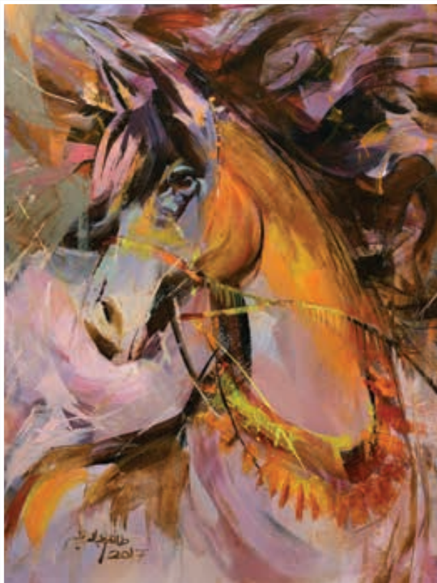
Oil painting 80 X 60