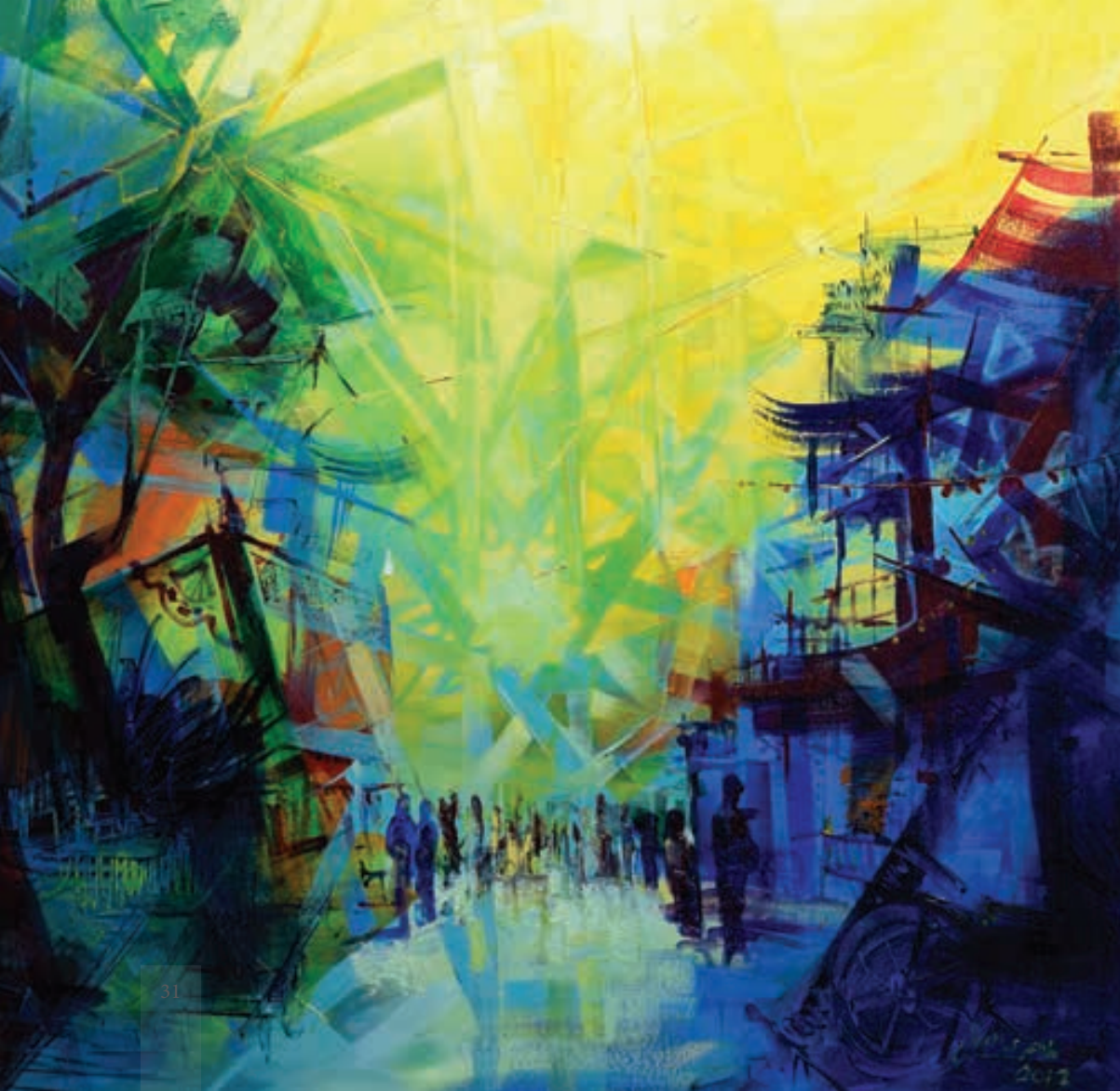
ألوان زيتية 100 × 100