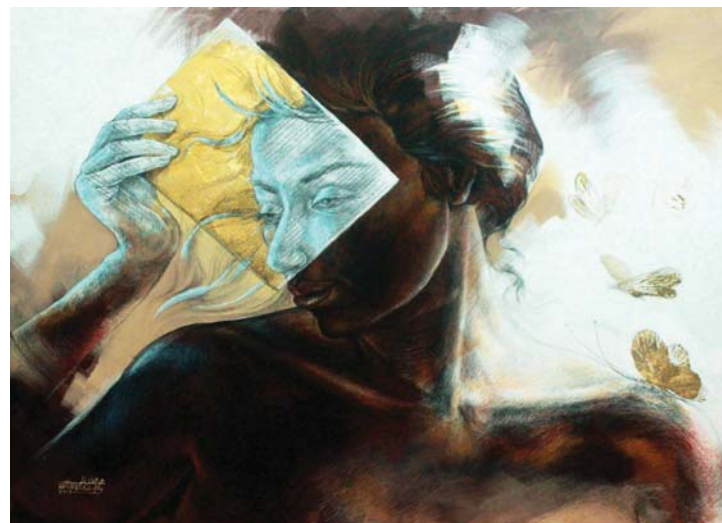
غلاف مزيف (٩٠X١٢٠) - رصاص و أكريلك على توال-٢٠١٧ a false cover -120X90cm- pencil & Acrylic on canvas – 2017