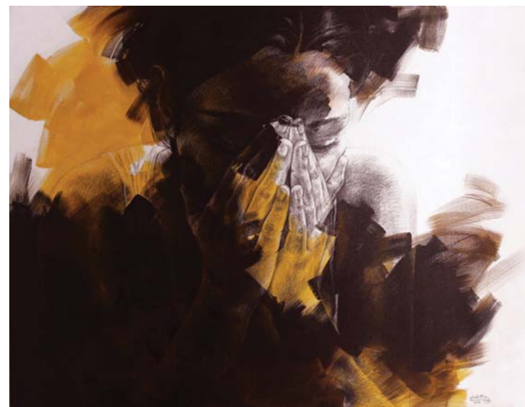
تمنيات - (١٣٠X١٠٠) - رصاص و أكرليك على توال-٢٠١٥ Wishes - 100x130cm- pencil & Acrylic on canvas – 2015