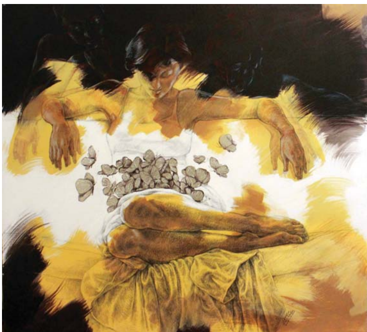
ترقب (١٣٠X١٥٠) - رصاص و أكرليك على توال-٢٠١٧ Expectation -150 X 130cm - pencil & Acrylic on canvas – 2017