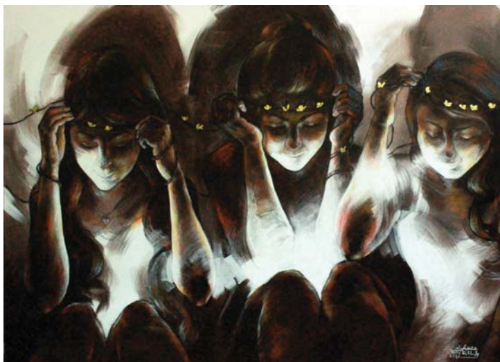
تاج أحلامنا (١٥٠X١٠٠) - رصاص و أكريلك على توال-٢٠١٧ The crown of our dreams -100X150cm- pencil & Acrylic on canvas – 2017