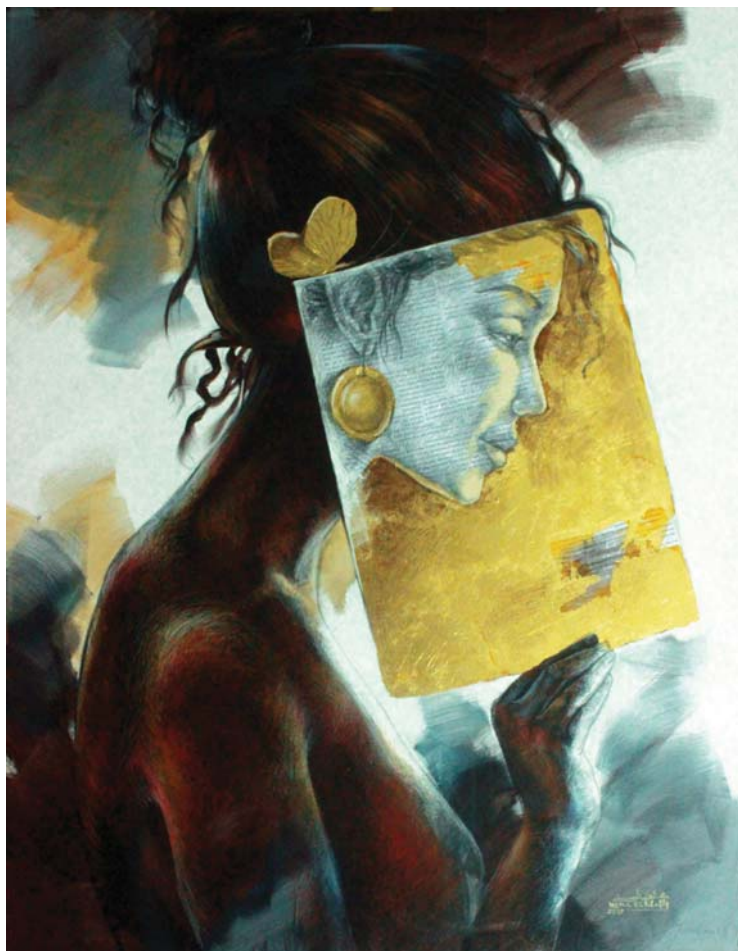
غلاف داخلي (١٠٠X١٣٠) - رصاص و أكرليك على توال-٢٠١٧ internal cover- 130X100cm- pencil & Acrylic on canvas – 2017