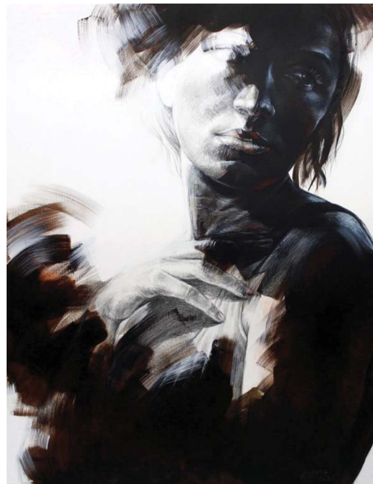
صدمة - (١٣٠X١٠٠) - رصاص و أكرليك على توال-٢٠١٥ shock - 100x130cm- pencil & Acrylic on canvas – 2015