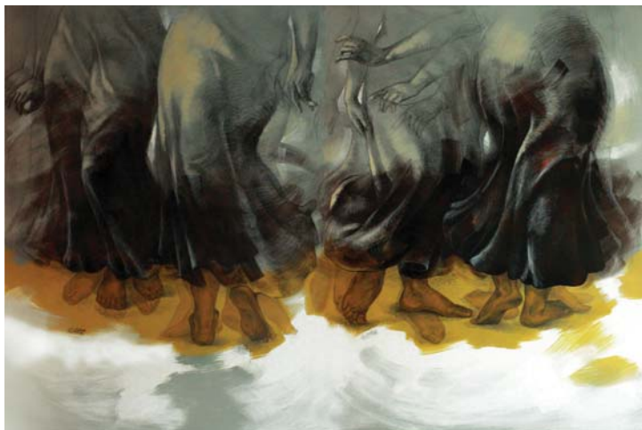
رقصة الحياة (٢٢٠X١٧٠) - رصاص و أكريلك على توال-٢٠١٧ Dance of life - 170 X 220 cm - pencil & Acrylic on canvas – 2017