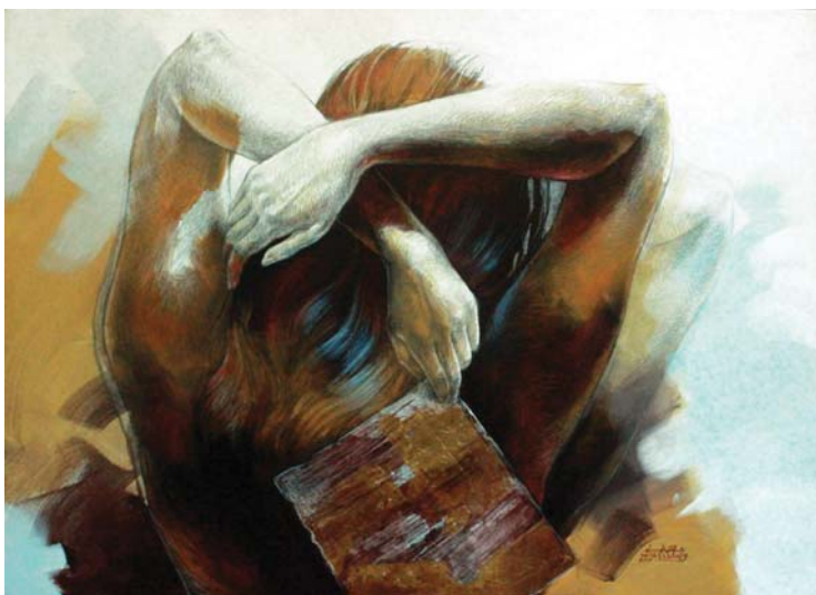
رسالة بحر - (٩٠X١٢٠) - رصاص و أكرليك على توال-٢٠١٧ a sea message - 120X90cm - pencil & Acrylic on canvas – 2017