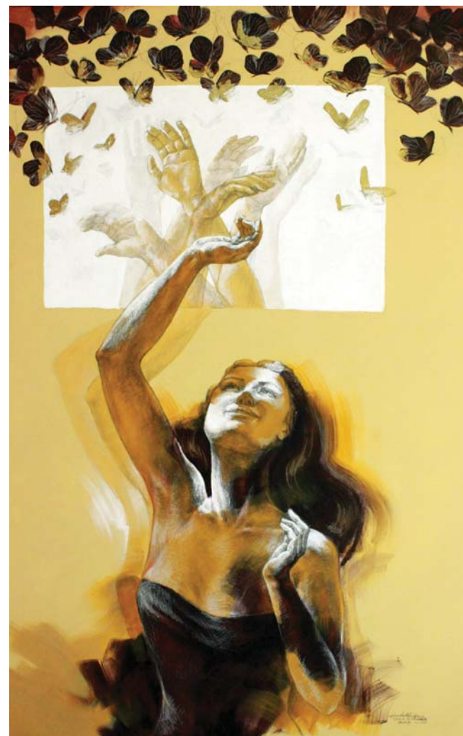
لحظة أمل (١٧٠X١١٠) - رصاص و أكرليك على توال-٢٠١٧ a moment of hope -110 X 170 cm - pencil & Acrylic on canvas – 2017