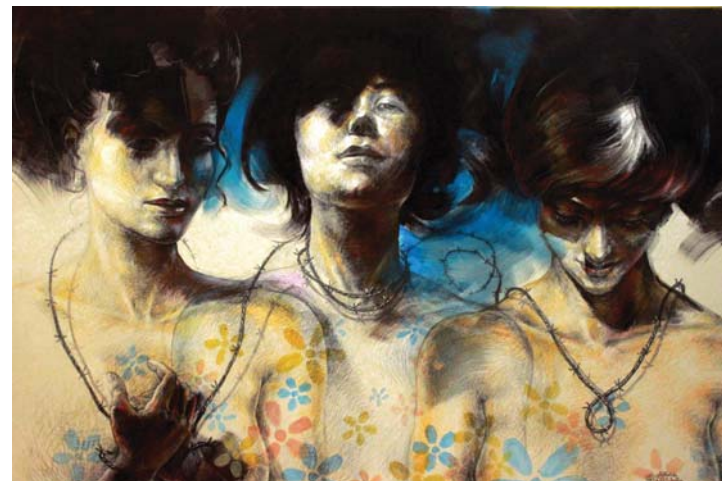
انا-انا العليا- أنا السفلى (١٠٠X١٥٠) - رصاص و أكريلك على توال-٢٠١٧ superego- ego- id -150 X 100cm - pencil & Acrylic on canvas – 2017