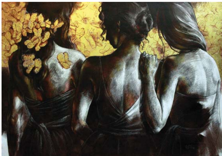
حوار بنات (١٠٠X١٥٠) - رصاص و أكريلك على توال-٢٠١٧ Girls dialogue -150 X 100cm - pencil & Acrylic on canvas – 2017