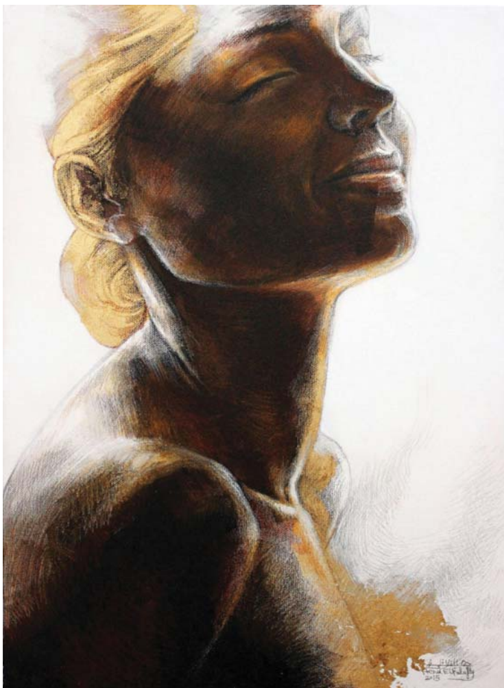
نقاء - (٧٠X٥٠) - رصاص و أكريليك على توال-٢٠١٥ Purity - 50x70cm- pencil & Acrylic on canvas – 2015