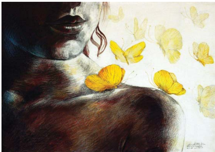
نسيم الصباح (٢) - (٧٠X٥٠) - رصاص و أكريلك على توال-٢٠١٧ Morning breeze 2 -50 X 70 cm - pencil & Acrylic on canvas – 2017