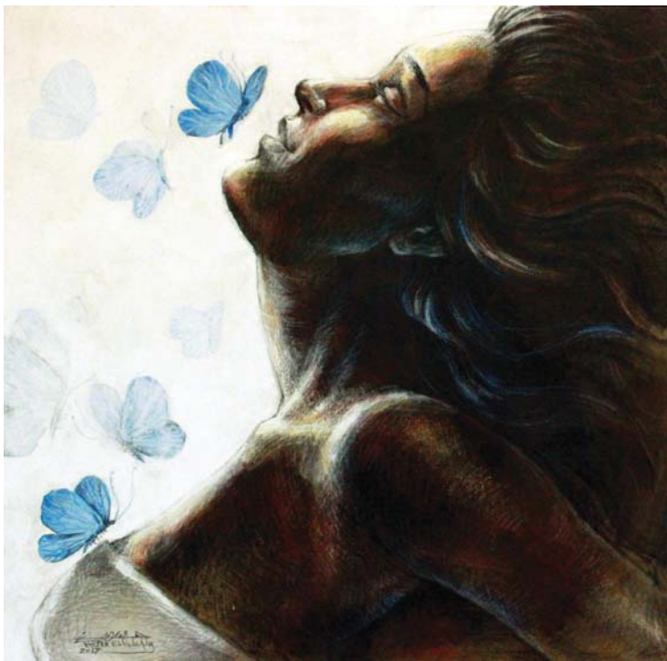
نسيم الصباح (١) - (٦٥X٥٥) - رصاص و أكرليك على توال-٢٠١٧ Morning breeze 1 -55 X 65 cm - pencil & Acrylic on canvas – 2017