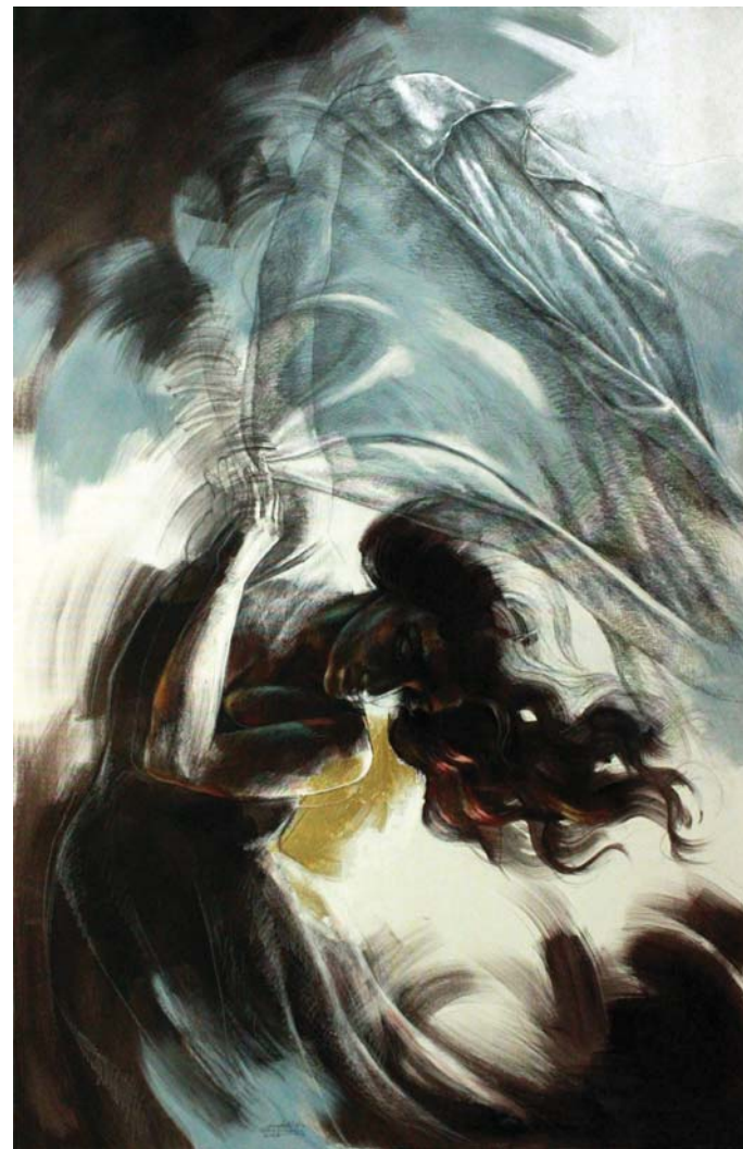
حرية - (١١٠X١٧٠) - رصاص و أكريلك على توال-٢٠١٧ a freedom -170 X 110cm - pencil & Acrylic on canvas – 2017