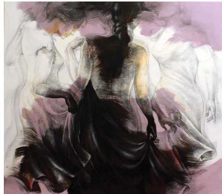
حركة المشاعر - (١٣٠X١٥٠) - رصاص و أكرليك على توال-٢٠١٧ Melody of feelings -150 X 130cm - pencil & Acrylic on canvas – 2017