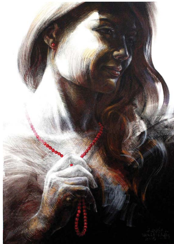
خجل - (٧٠X٥٠) - رصاص و أكريليك على توال-٢٠١٥ Ashamed- 50x70cm- pencil & Acrylic on canvas – 2015