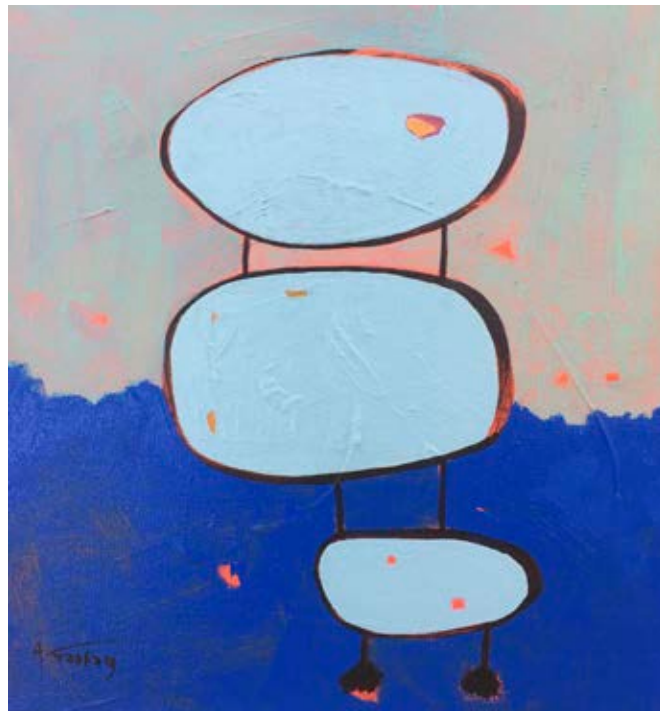
Acrylic on canvas 37×35 cm