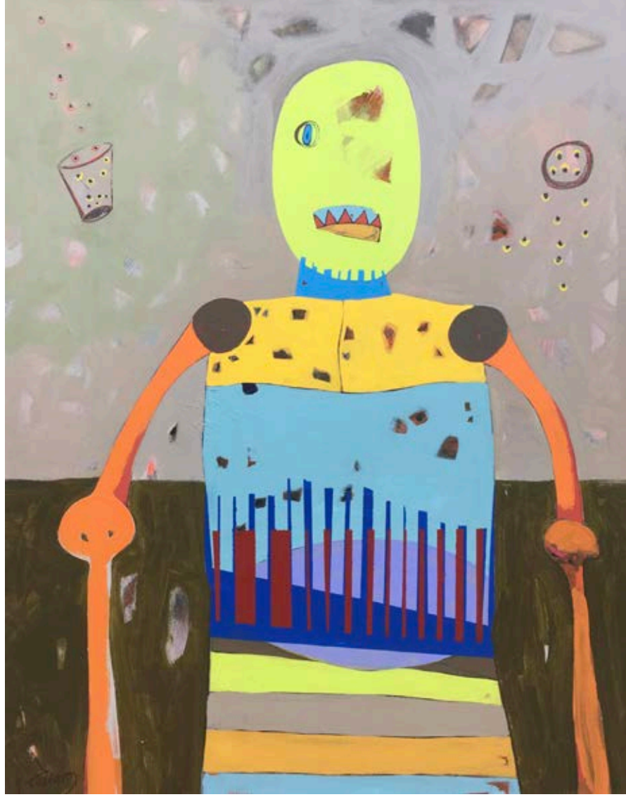
Acrylic on canvas 95×120 cm