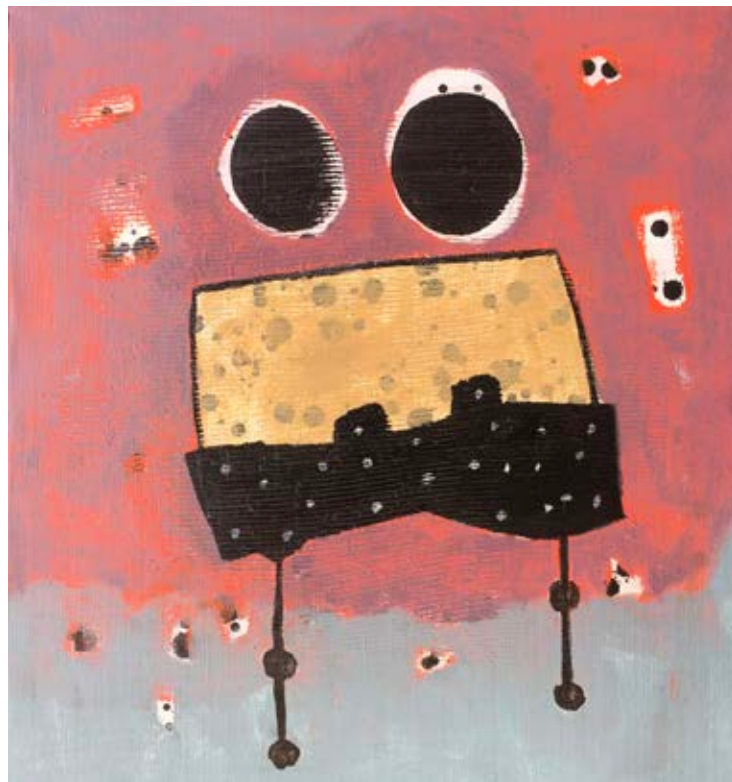
Acrylic on canvas 48x45 cm