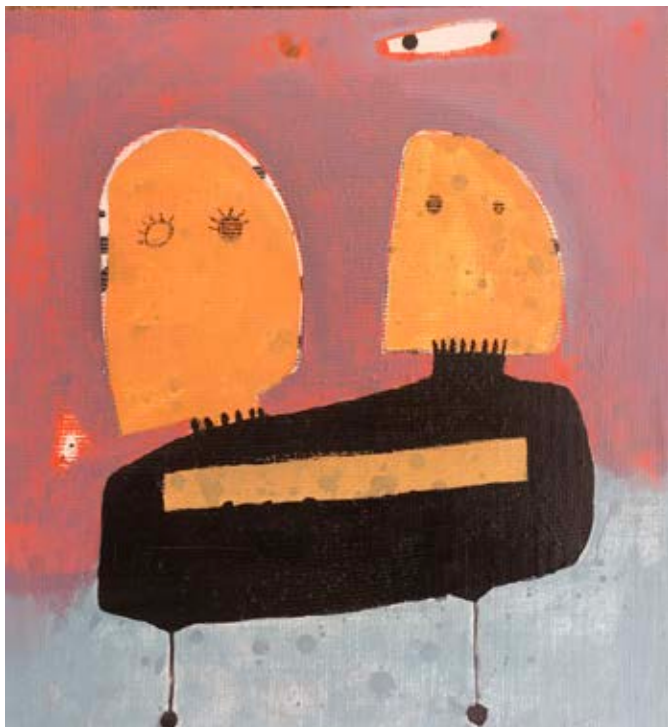
Acrylic on canvas 48x45 cm