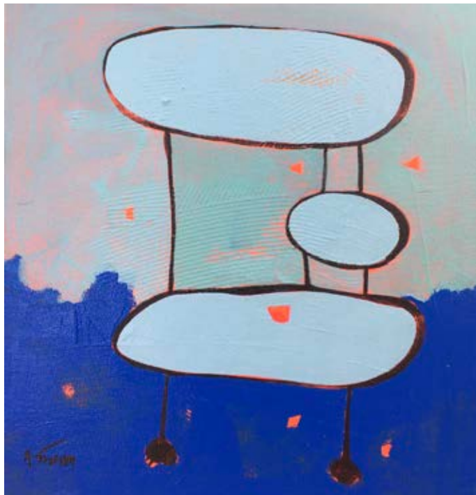
Acrylic on canvas 37×35 cm