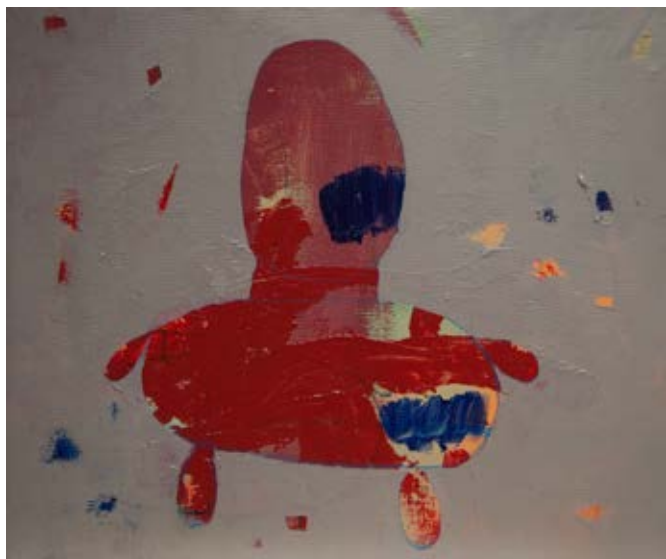
Acrylic on canvas 60×50 cm