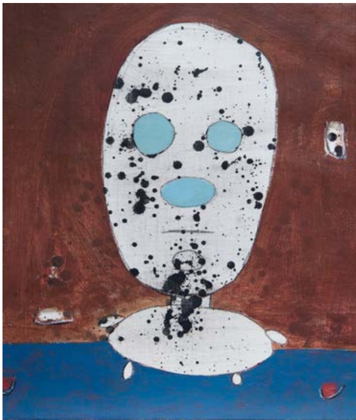
Acrylic on canvas 55×45 cm