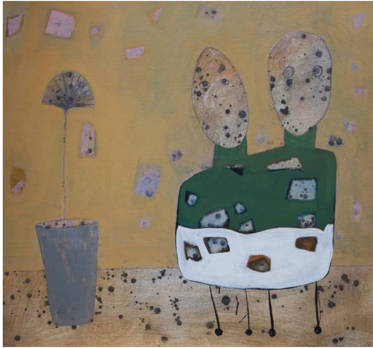
Acrylic on canvas 90x95 cm