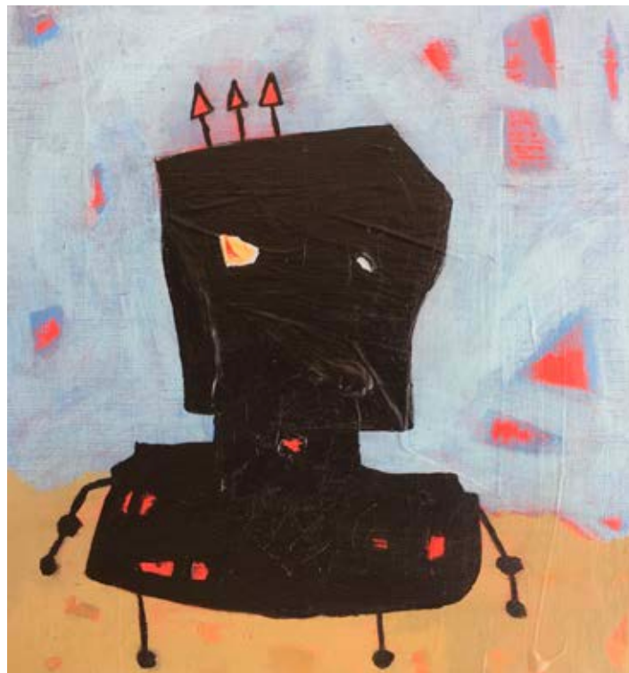
Acrylic on canvas 48×45 cm