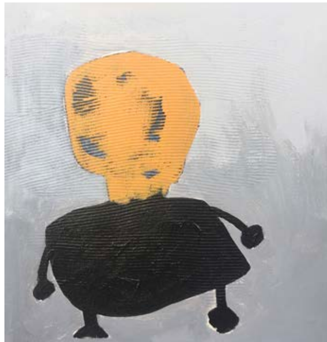
Acrylic on canvas 37×35 cm