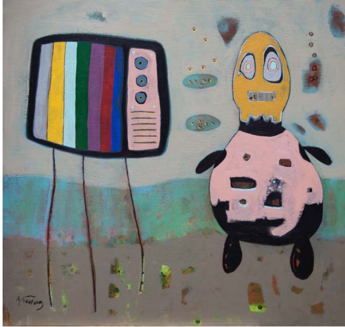
Acrylic on canvas 90x95 cm