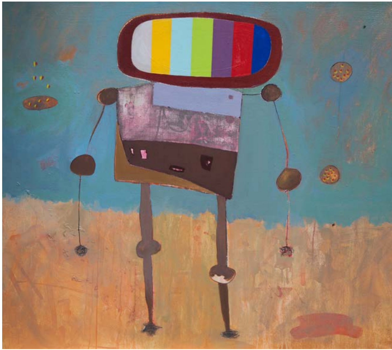
Acrylic on canvas 107×95 cm