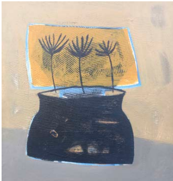
Acrylic on canvas 37×35 cm