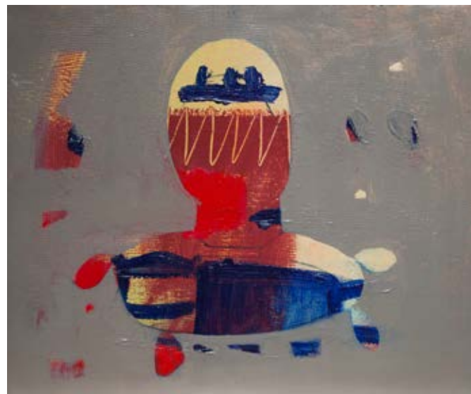
Acrylic on canvas 60×50 cm