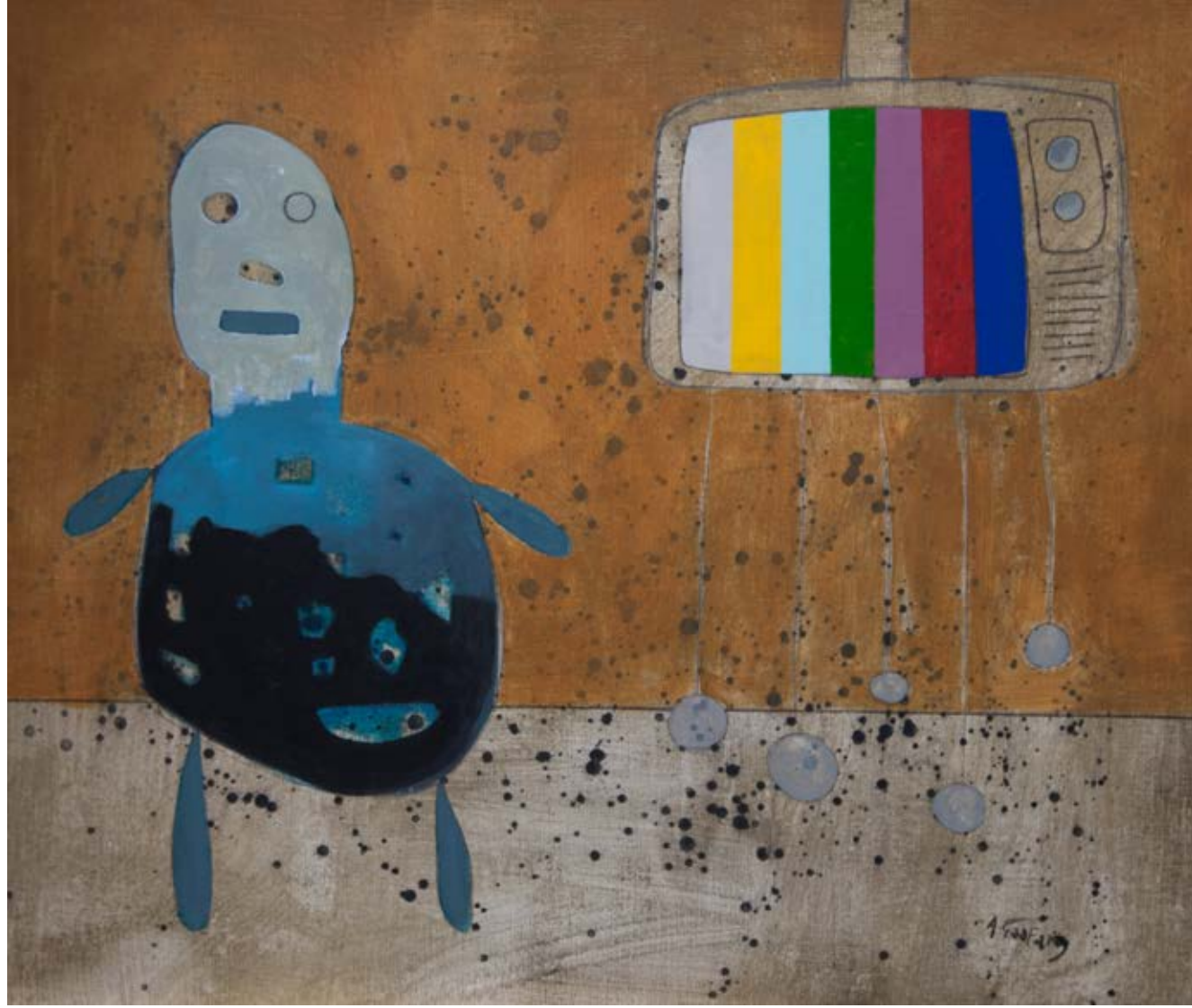
Acrylic on canvas 107×95 cm