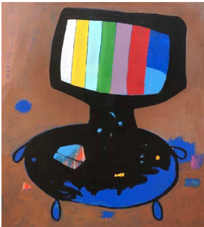
Acrylic on canvas 55x50 cm