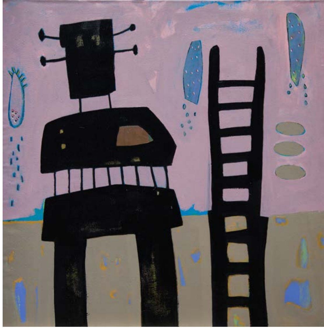
Acrylic on canvas 95x95 cm