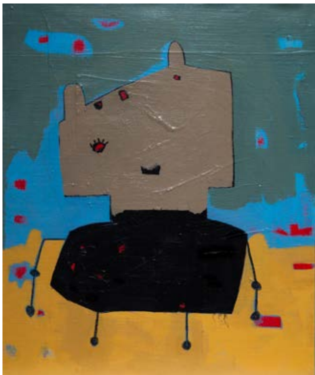
Acrylic on canvas 55×45 cm