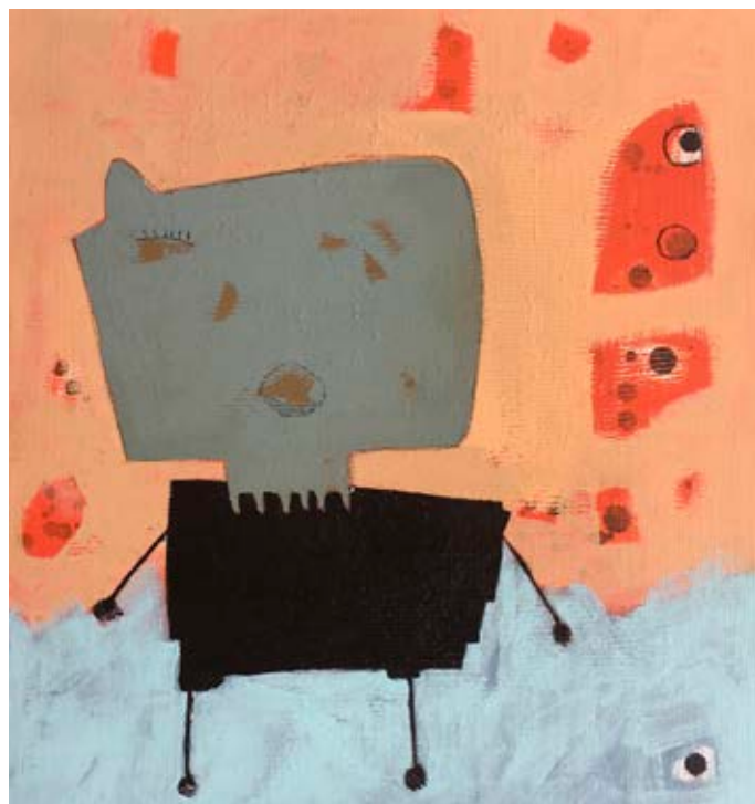
Acrylic on canvas 48x45 cm