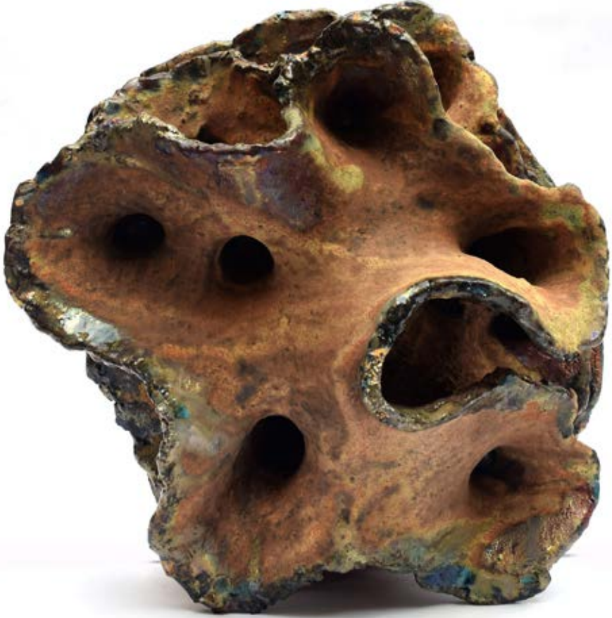
الخامات : طينات أرضية وطلاءات زجاجية مطفي ولامع التقنية: الحريق ١٠٥٠ ومع استخدام تقنية الاختزال داخل الفرن واستخدام صبغات وأكاسيد معدنية متنوعة مثل الفضة وكربونات البيزموت وأكسيد النحاس والليثيوم والمنجيز المقاس : ٤٠×٢٠×٤٠