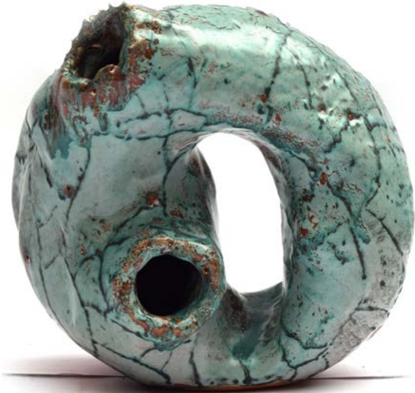
الخامات : طينات أرضية وطلاءات زجاجية مطفي ولامع التقنية: الحريق ١٠٥٠ ومع استخدام تقنية الاختزال داخل الفرن واستخدام صبغات وأكاسيد معدنية متنوعة مثل الفضة وكربونات البيزموت وأكسيد النحاس والليثيوم المقاس : ١٢×٢٠×١٩