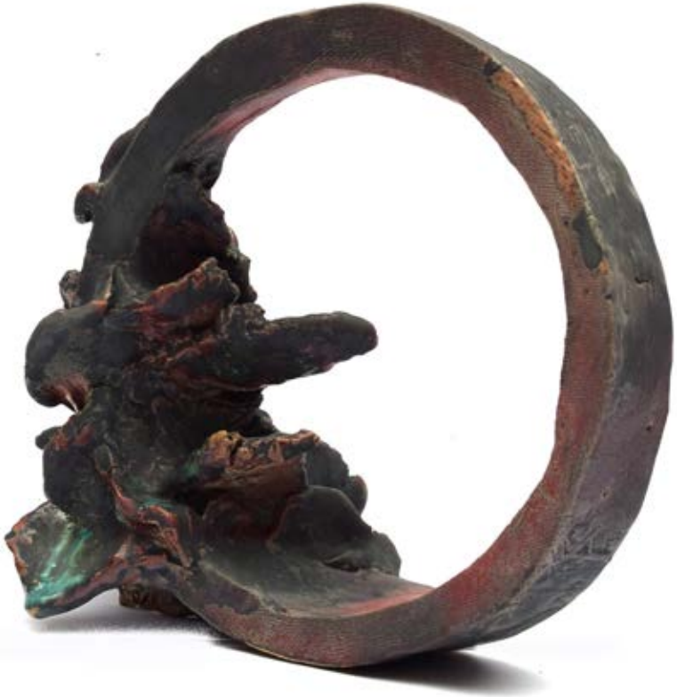
الخامات: طينات أرضية وطلاءات زجاجية مطفية التقنية: الحريق ١٠٥٠ ومع استخدام تقنية الاختزال داخل الفرن وإستخدام أكاسيد معدنية متنوعة مثل الفضة وكربونات البزموت وأكسيد النحاس والليثيوم المقاس: ٢٩× ٢٥ ×٦