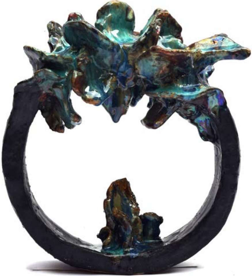
الخامات : طينات أرضية وطلاءات زجاجية مطفي ولامع التقنية: الحريق ١٠٥٠ ومع استخدام تقنية الاختزال داخل الفرن وإستخدام صبغات وأكاسيد معدنية متنوعة مثل الفضة وكربونات البيزموت وأكسيد النحاس والليثيوم المقاس : ٢٠×٢٤×٥