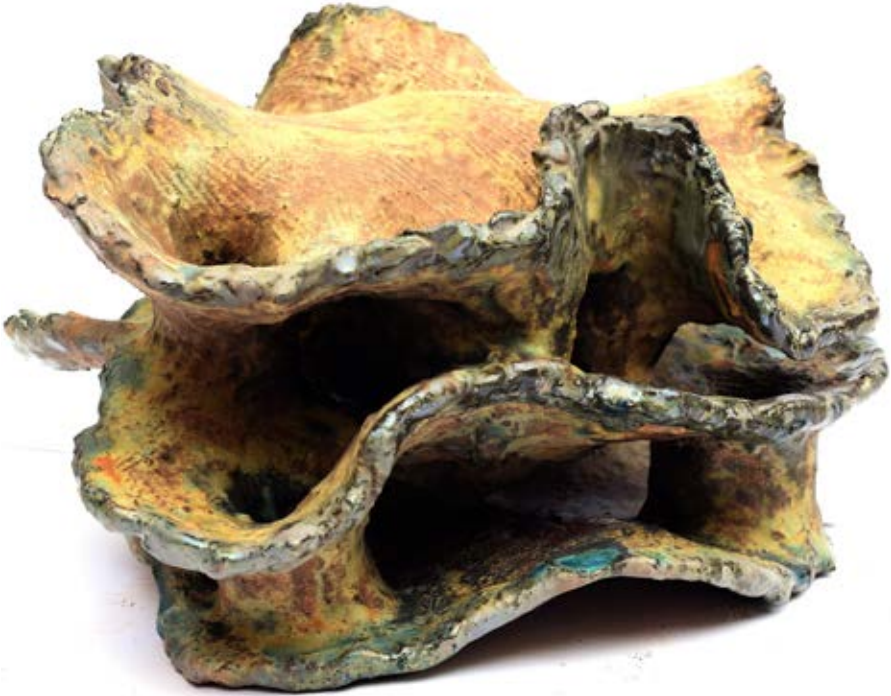
الخامات : طينات أرضية وطلاءات زجاجية مطفي ولامع التقنية: الحريق ١٠٥٠ ومع استخدام تقنية الاختزال داخل الفرن واستخدام صبغات وأكاسيد معدنية متنوعة مثل الفضة وكربونات البيزموت وأكسيد النحاس والليثيوم والمنجنيز المقاس : ٢٤×٣٦×٣٨