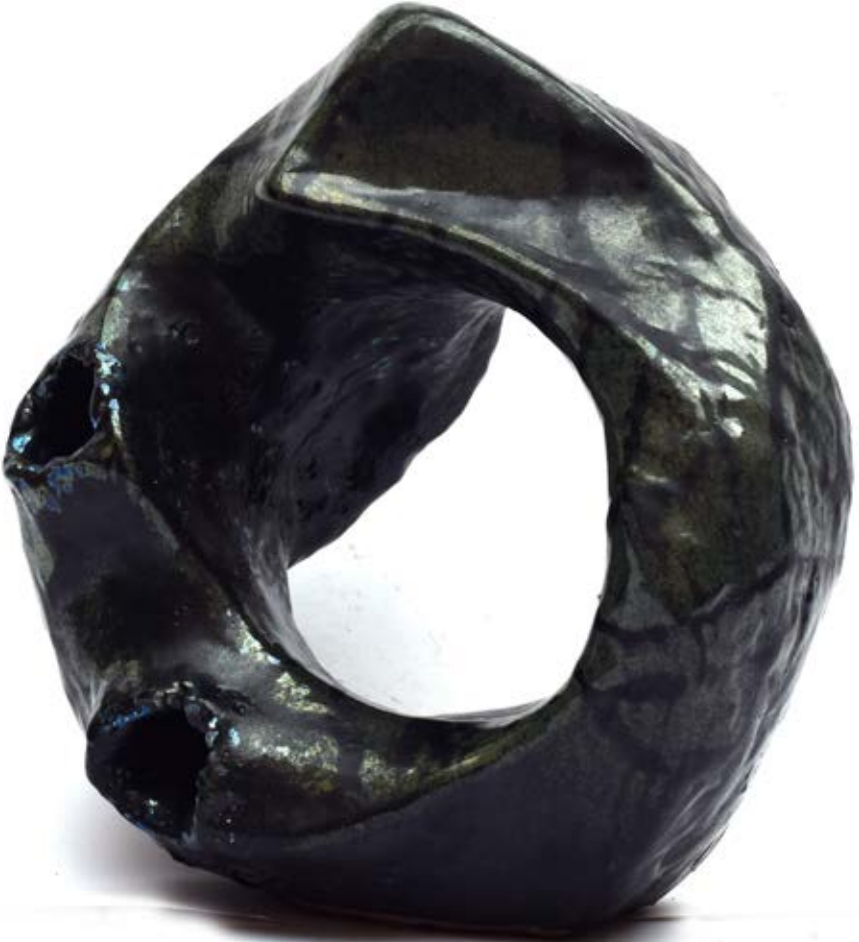
الخامات : طينات أرضية وطلاءات زجاجية مطفي ولامع التقنية: الحريق ١٠٥٠ ومع استخدام تقنية الاختزال داخل الفرن واستخدام صبغات وأكاسيد معدنية متنوعة مثل الفضة وكربونات البزموت وأكسيد النحاس والليثيوم المقاس : ٢٤×٢٥×١٨