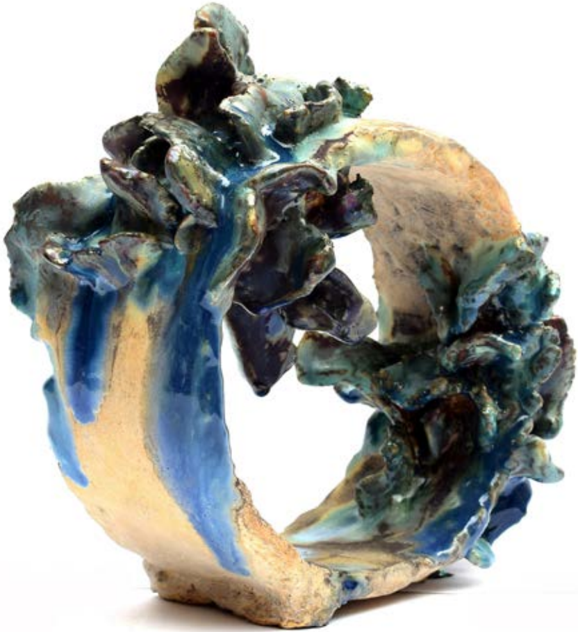
الخامات: طينات أرضية وطلاءات زجاجية مطفي ولامع التقنية: الحريق ١٠٥٠ ومع استخدام تقنية الاختزال داخل الفرن وإستخدام أكاسيد معدنية متنوعة مثل الفضة وكربونات البزموت وأكسيد النحاس والليثيوم المقاس: ٢٨ × ٢٥ × ١٠