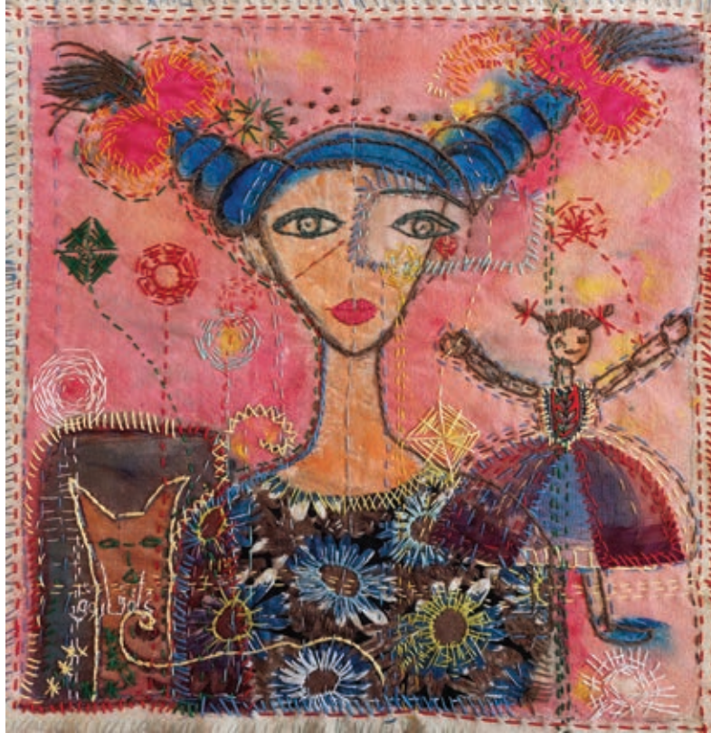
Painting and Mixed Mediums on Fabric 50 x 50 cm 2021

رسم وخامات مختلفة على القماش ٥٠ × ٥٠ سم ٢٠٢١