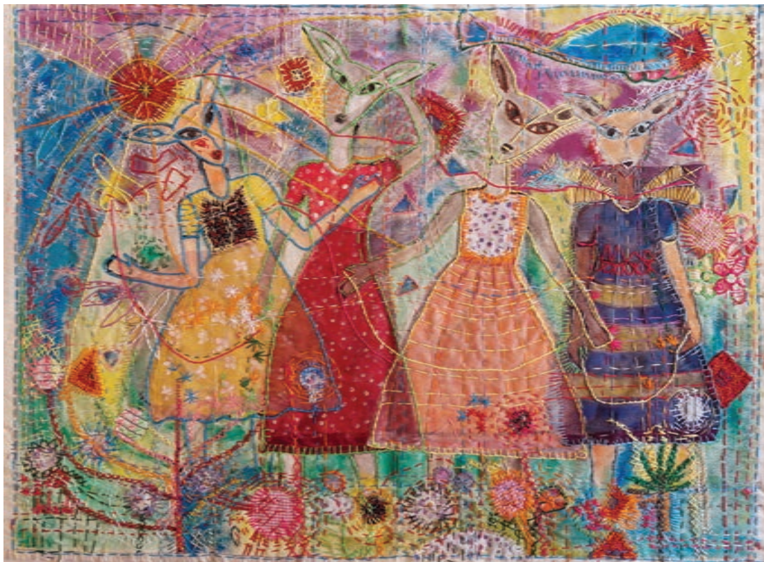
Painting and Mixed Mediums on Fabric