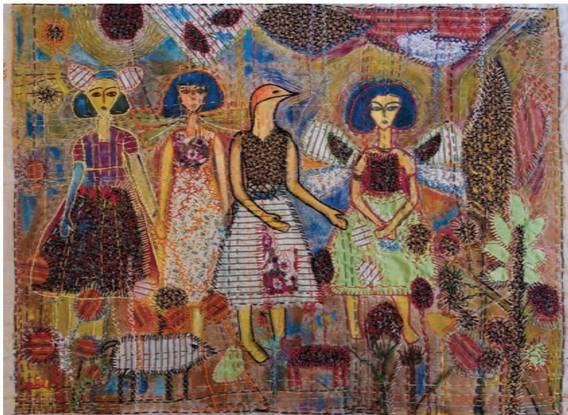
Painting and Mixed Mediums on Fabric