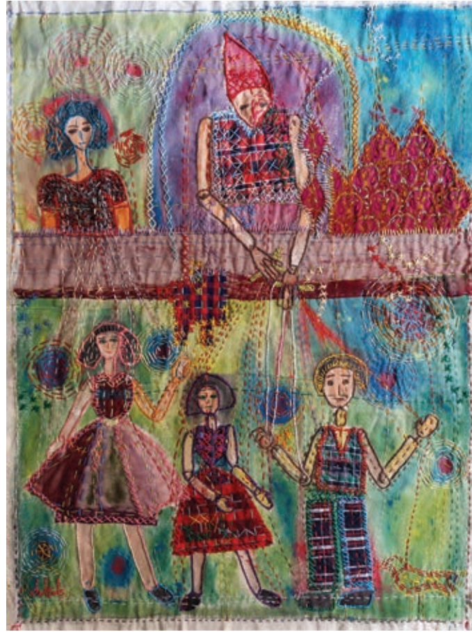
رسم وخامات مختلفة على القماش ١٠٠ × ٧٠ سم ٢٠٢١

Painting and Mixed Mediums on Fabric 100 × 70 cm 2021