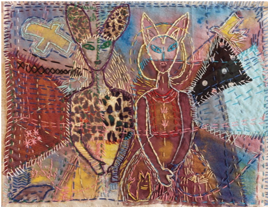
Painting and Mixed Mediums on Fabric