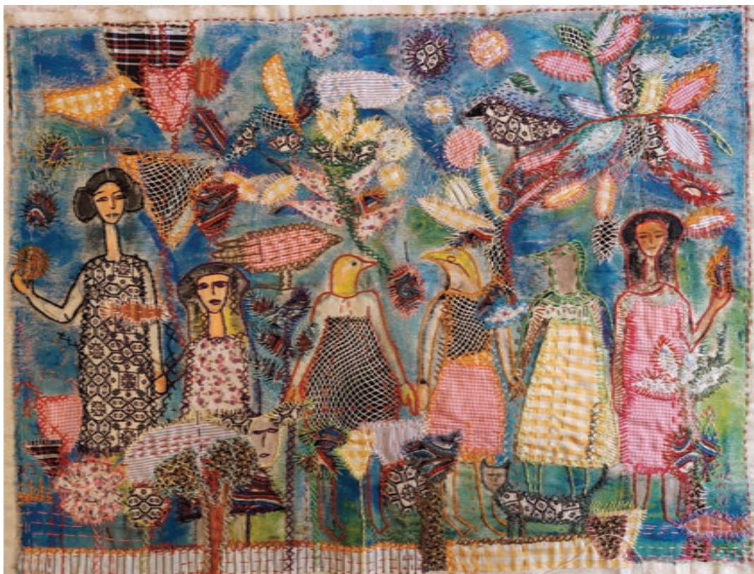
Painting and Mixed Mediums on Fabric