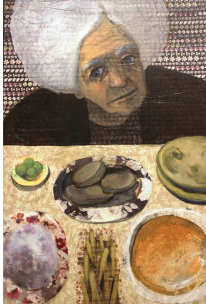
الغذاء 70/100 سم ألوان زيتية مع وسائط متعددة على كرتون 2017