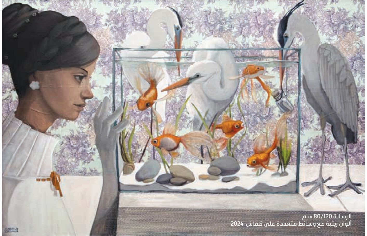
الرسالة 80/120 سم ألوان زيتية مع وسائط متعددة على قماش 2024