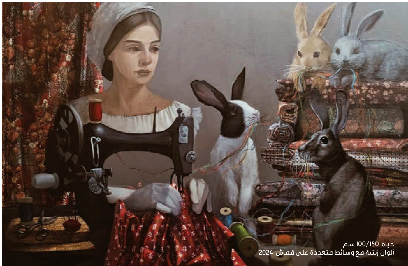
حياة 100/150 سم ألوان زيتية مع وسائط متعددة على قماش 2024