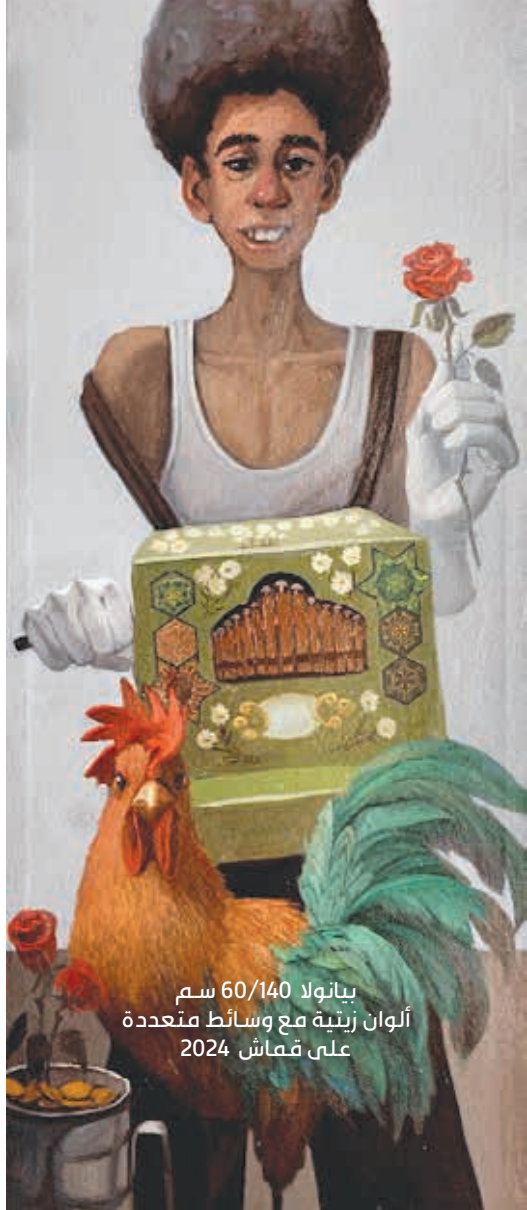
بيانولا 60/140 سم ألوان زيتية مع وسائط متعددة على قماش 2024