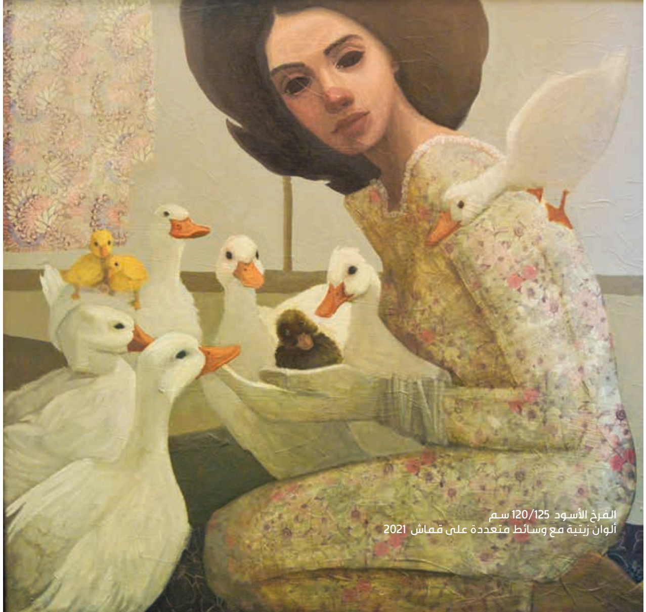
الفرخ الأسود 120/125 سم ألوان زيتية مع وسائط متعددة على قماش 2021