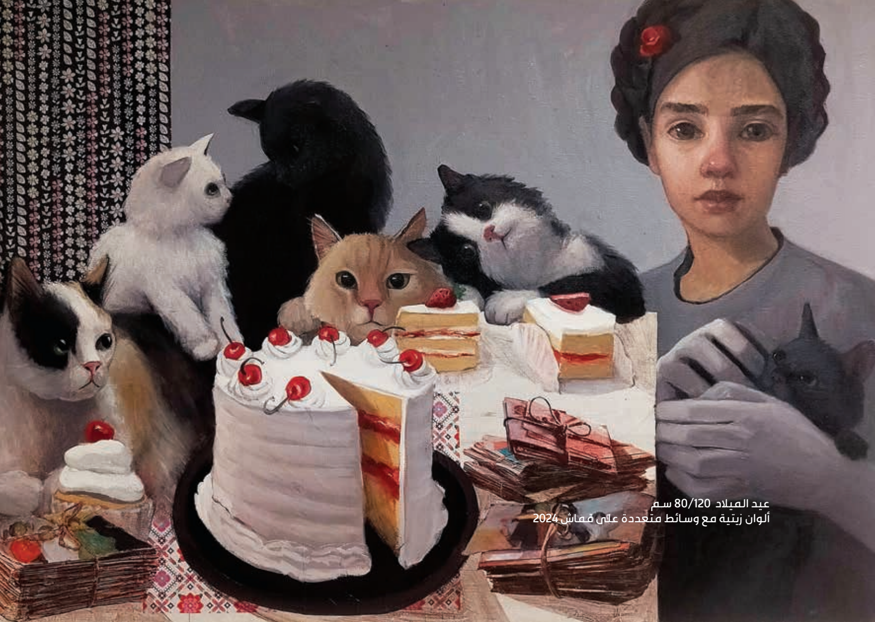
عيد الميلاد 80/120 سم ألوان زيتية مع وسائل متعددة على قماش 2024