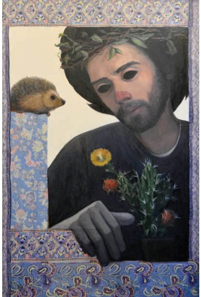
أشواك ممطرة 80/120 سم ألوان زيتية مع وسائط متعددة على قماش 2021