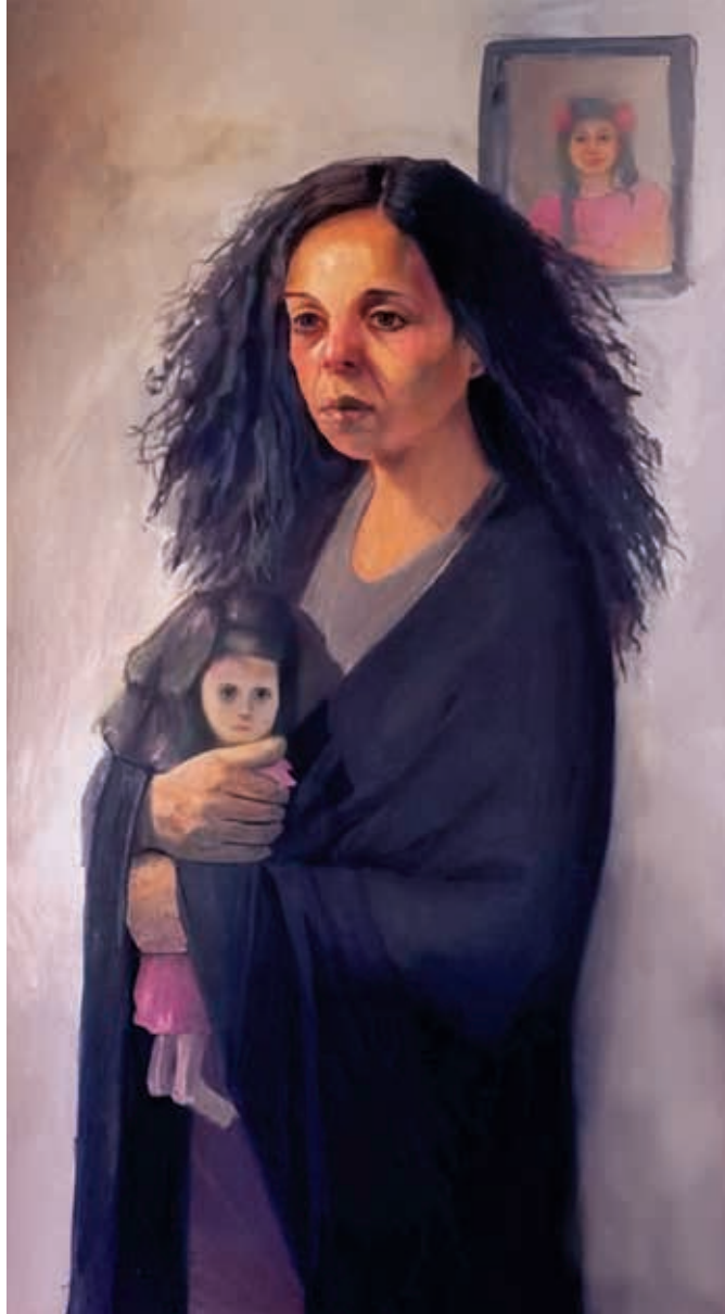
أم وفاء 60/100 سم ألوان زيتية مع وسائط متعددة على قماش 2004