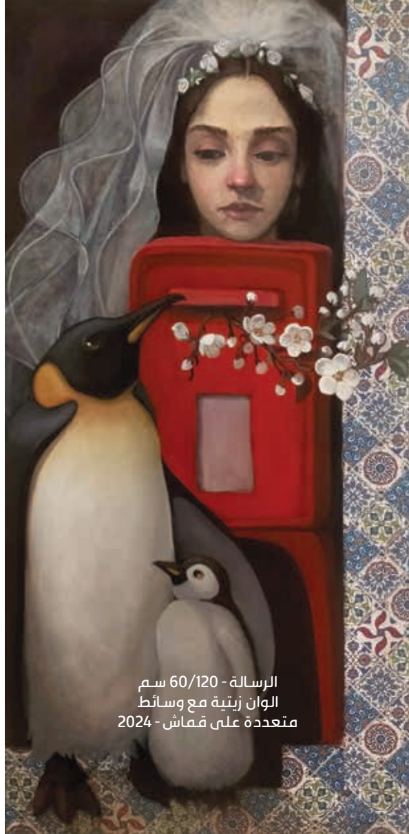
الرسالة - 60/120 سم الوان زيتية مع وسائط متعددة على قماش - 2024