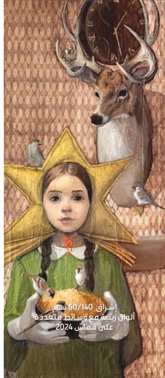
إشراق 60/140 سم ألوان زيتية مع وسائط متعددة على قماش 2024