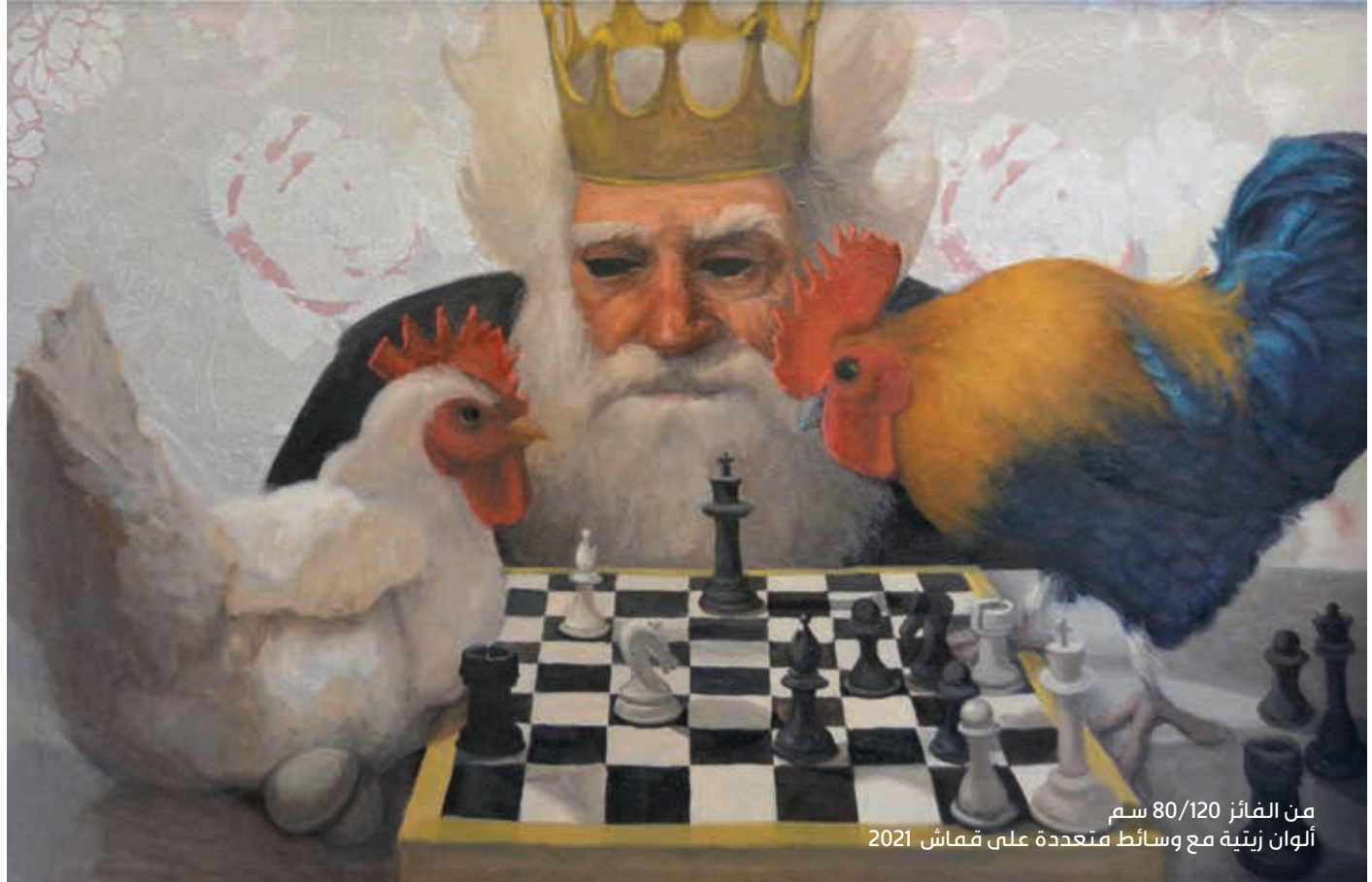
من الفائز 80/120 سم ألوان زيتية مع وسائط متعددة على قماش 2021