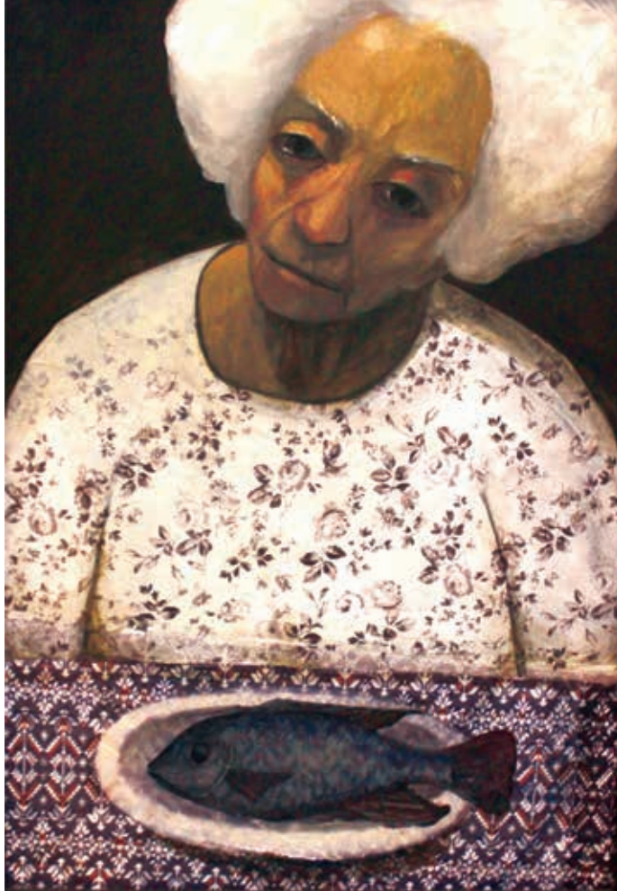
السمكة 70/100 سم ألوان زيتية مع وسائط متعددة على قماش 2017