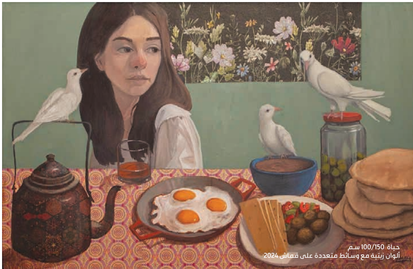
حياة 100/150 سم ألوان زيتية مع وسائط متعددة على قماش 2024