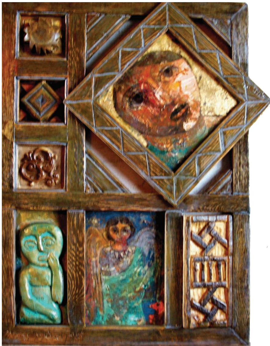
حفر ملون علی خشب - تصویر زیتی ۷۰X۵۰ سم