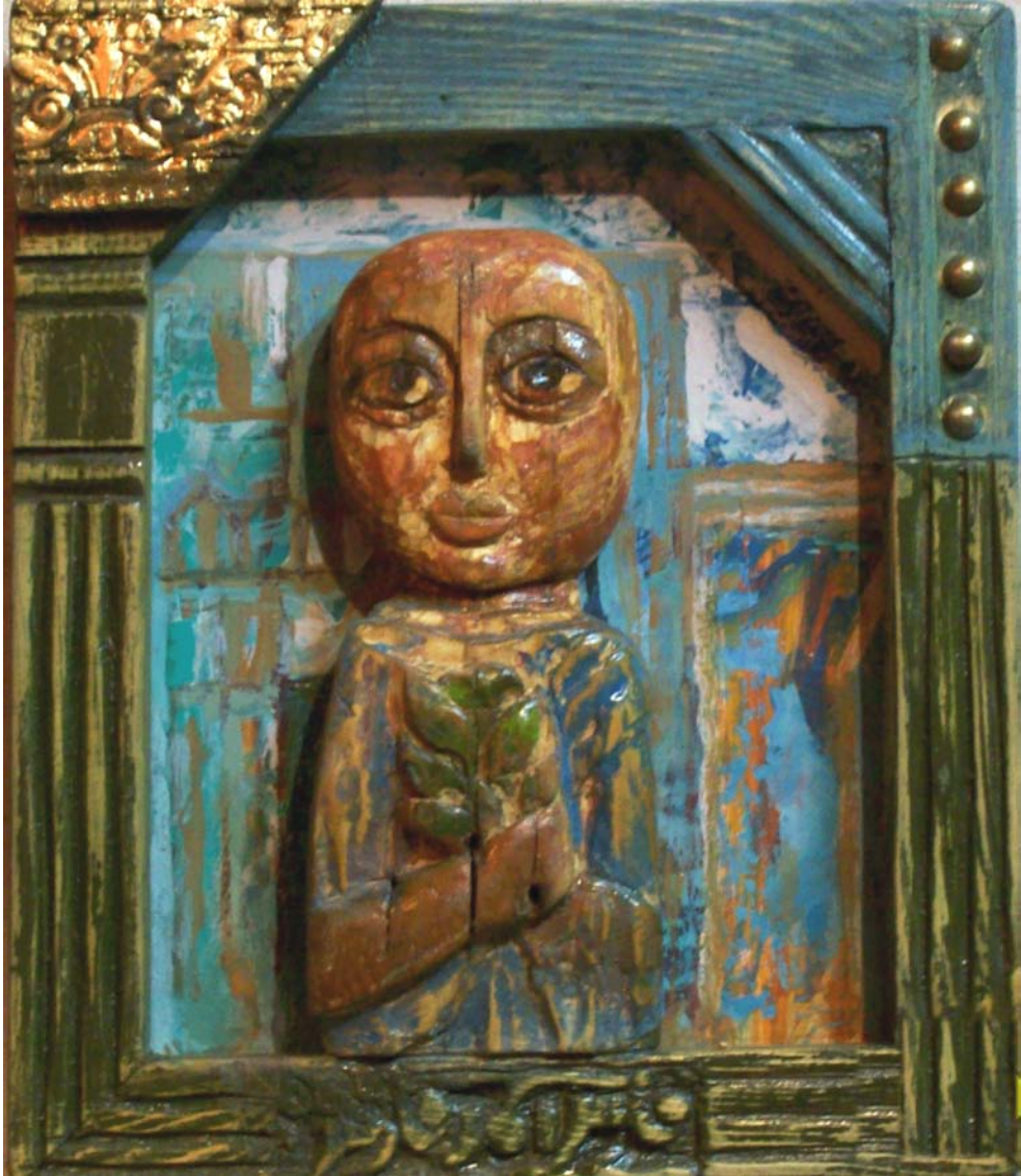
حفر ملون علی خشب - تصویر زیتی - ۴۰X ۴۰ سم