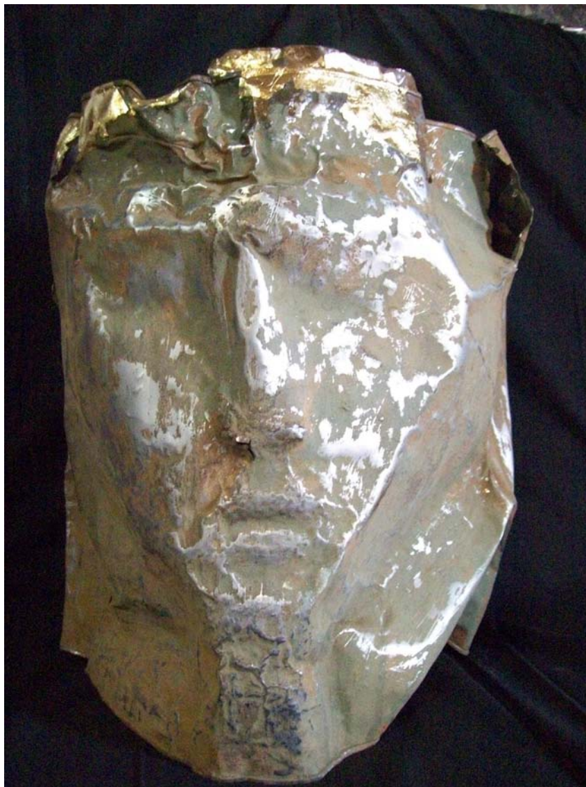
بورتیه صالح - ۴۰X۵۰X۵۰ سم