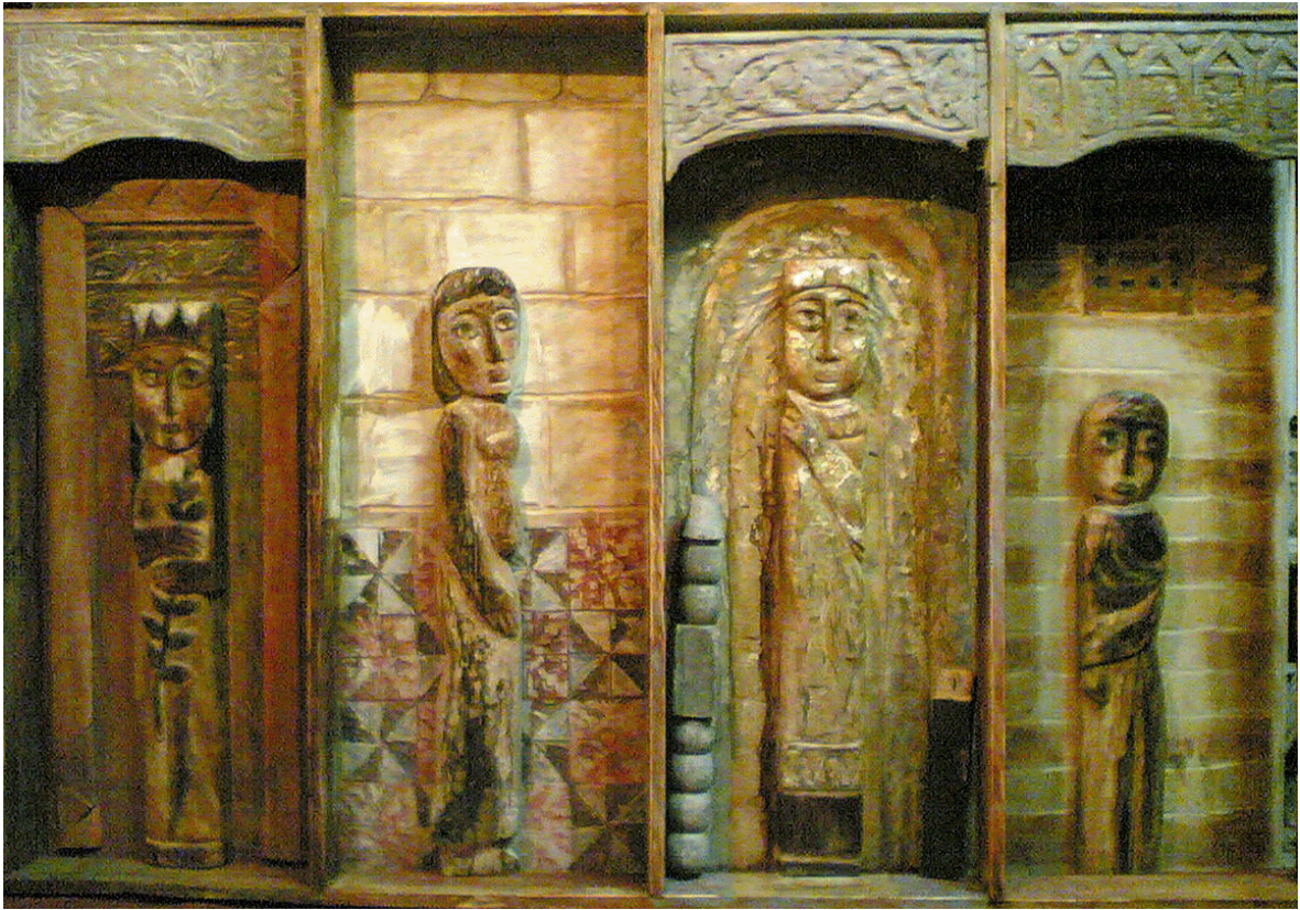
تفصيلي - حفر ملون علی خشب - ۱۰۰X۲۰۰ سم