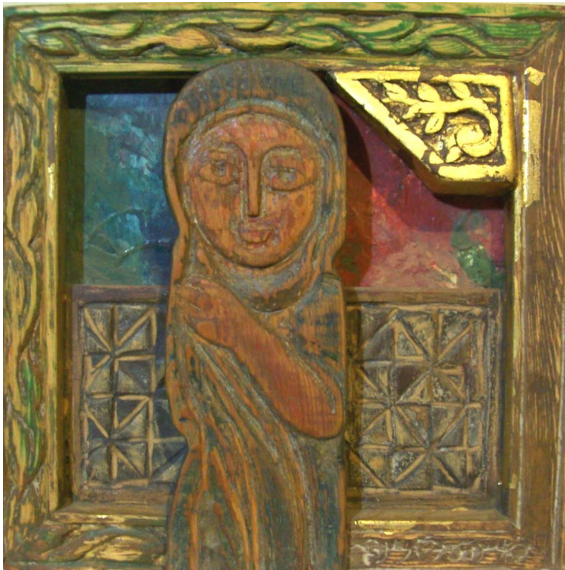
حفر ملون علی خشب - تصویر زیتی - ۴۰X۴۰ سم