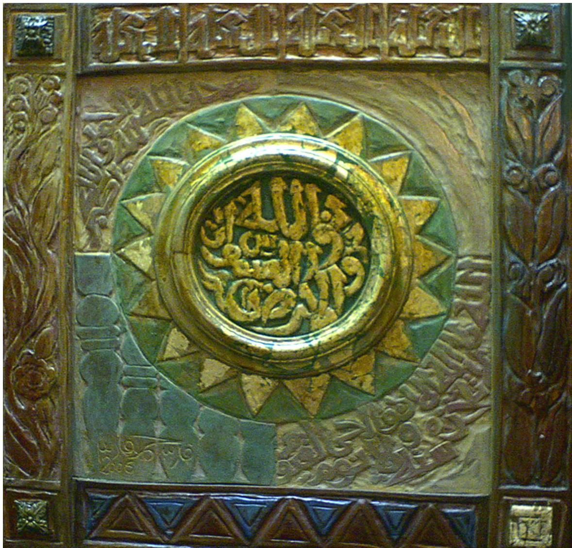
حفر ملون علی خشب - ۷۰X۷۰ سم