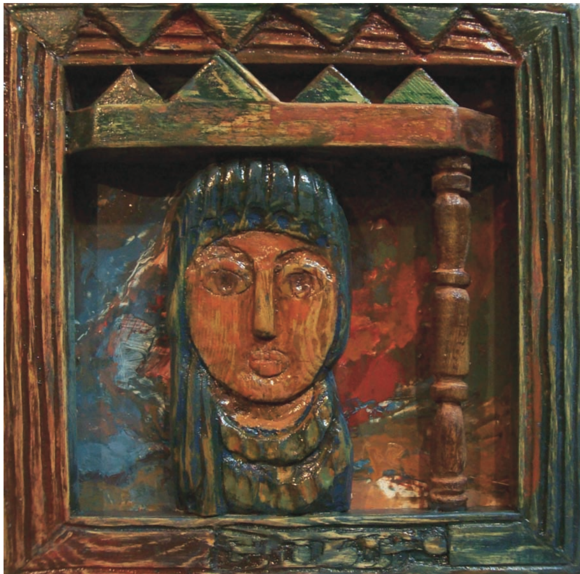
حفر ملون علی خشب - تصویر زیتي ۴۰ X ۴۰ سم