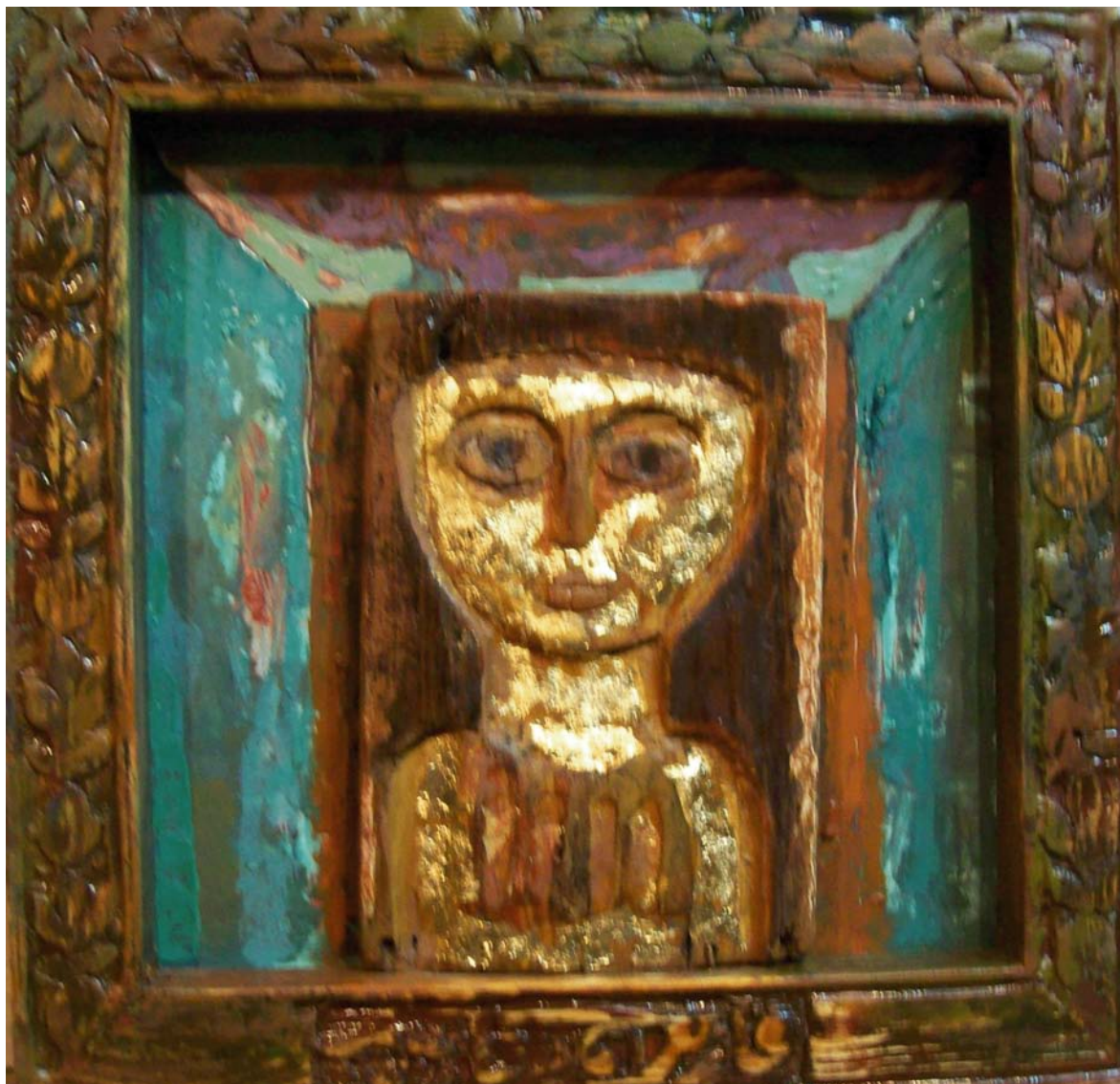
حفر ملون علی خشب - تصویر زیتي - ۴۰X۴۰ سم