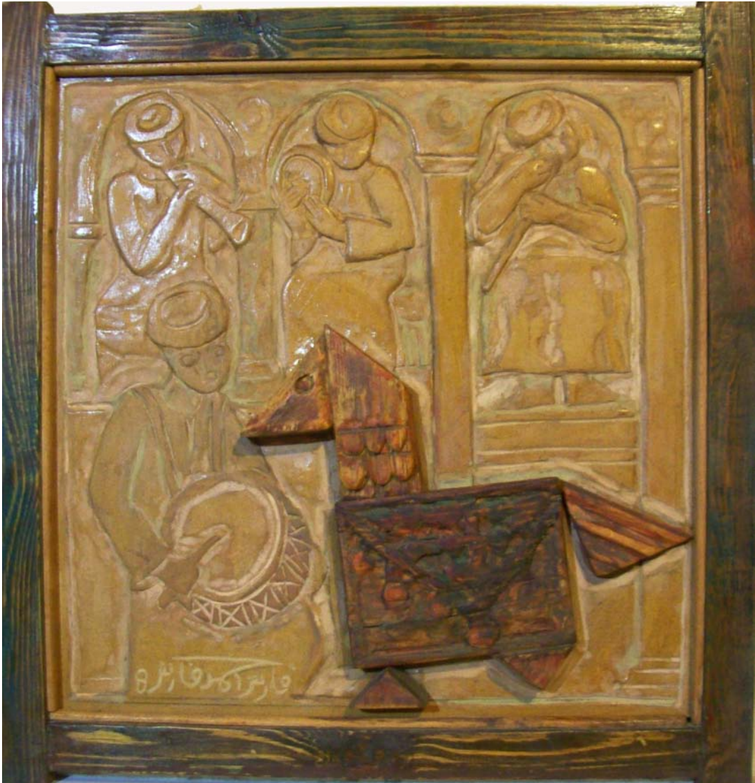
حفر ملون علی خشب - ۷۰X۷۰ سم