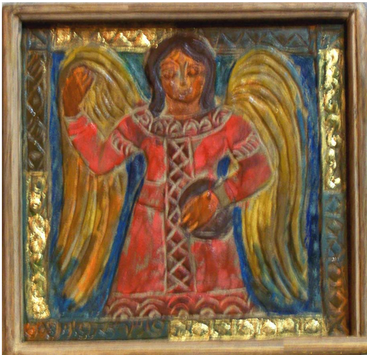
حفر ملون علی خشب - ۴۰×۴۰ سم