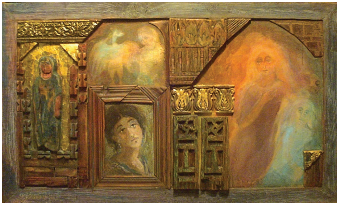
حفر ملون علی خشب - تصویر زیتي - ۱۰X۹۰ سم