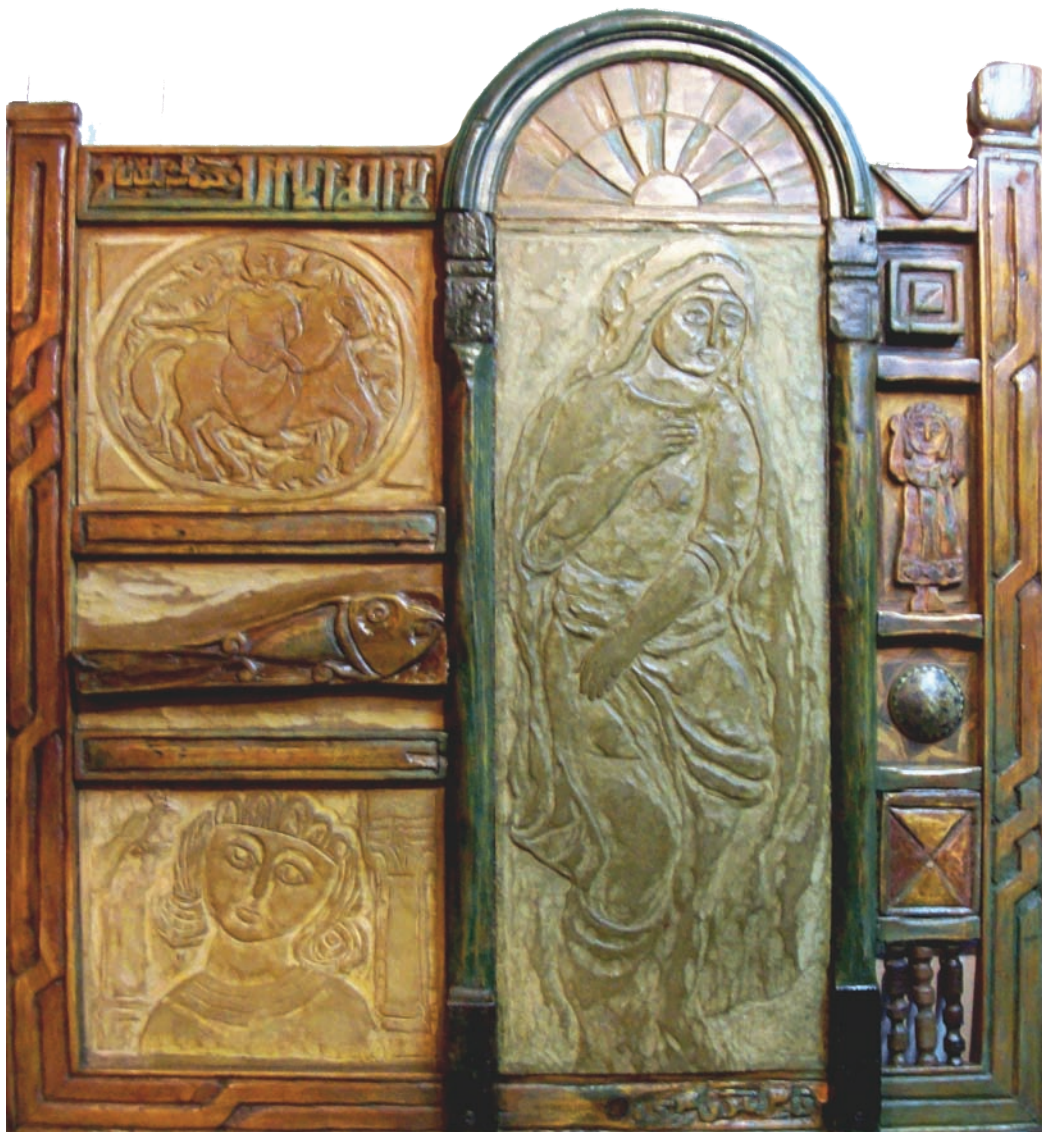
حفر ملون علی خشب - ۱۰۰X۱۰۰ سم