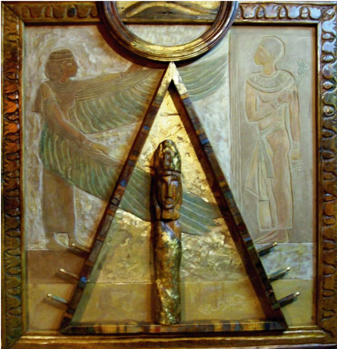
حفر ملون علی خشب - ۱۰۰X۱۰۰ سم