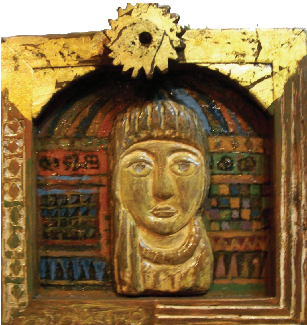
حفر ملون علی خشب - تصویر زیتی - ۴۰ X ۴۰ سم