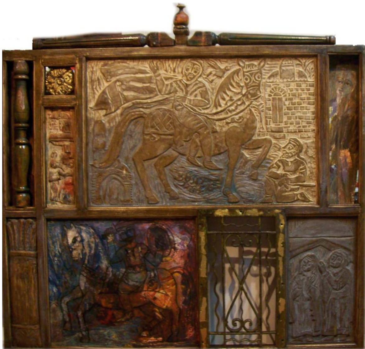
حفر ملون علی خشب - تصویر زینتی وحید ۱۰۰X۱۰۰ سم