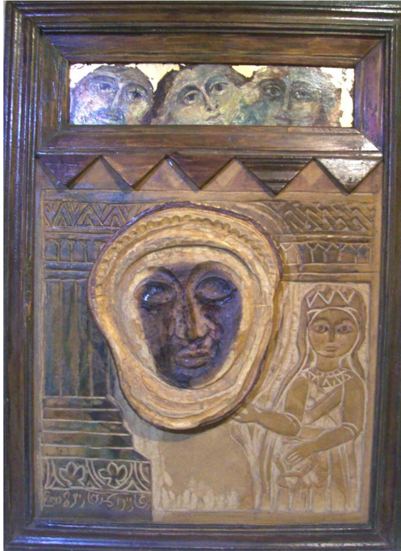
حفر ملون علی خشب - تصویر زیتی ۸۰X۶۰ سم