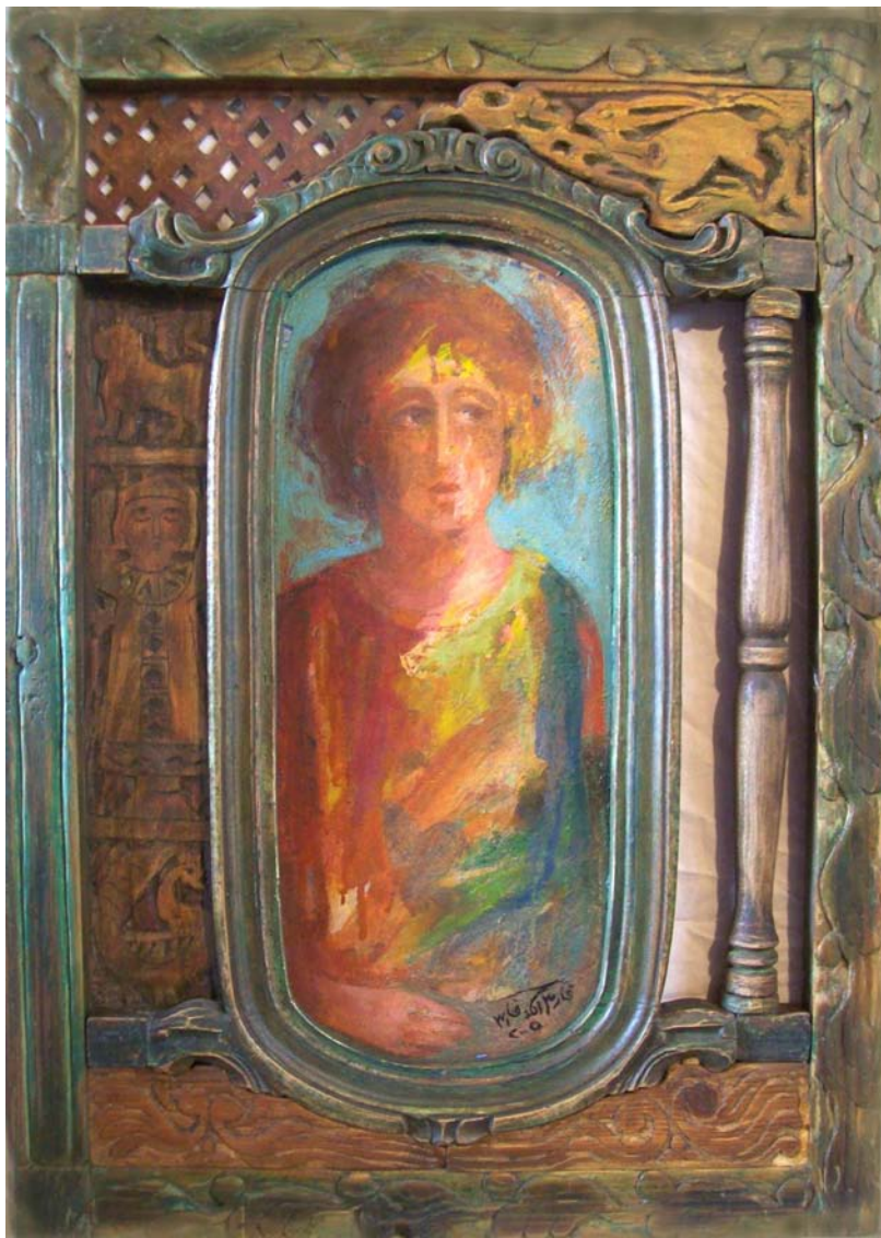
حفر ملون علی خشب - تصویر زیتي - ۷۰X۵۰ سم