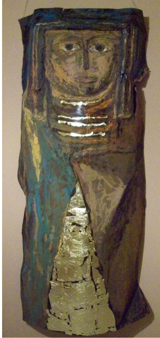
صاج ملون - ٢٠٠X١٠٠ سم