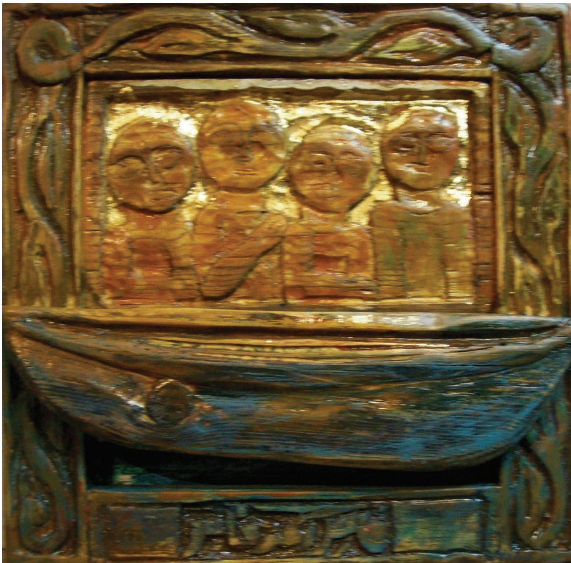
حفر ملون علی خشب - ۴۰X۴۰ سم