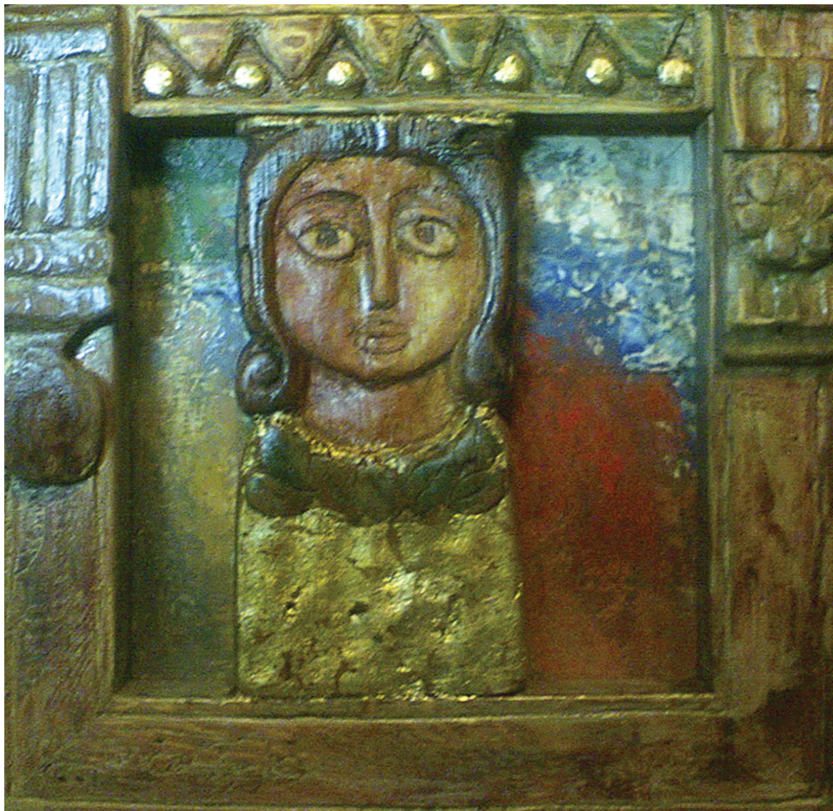
حفر ملون علی خشب - تصویر زیتی - ۴۰ X ۴۰ سم