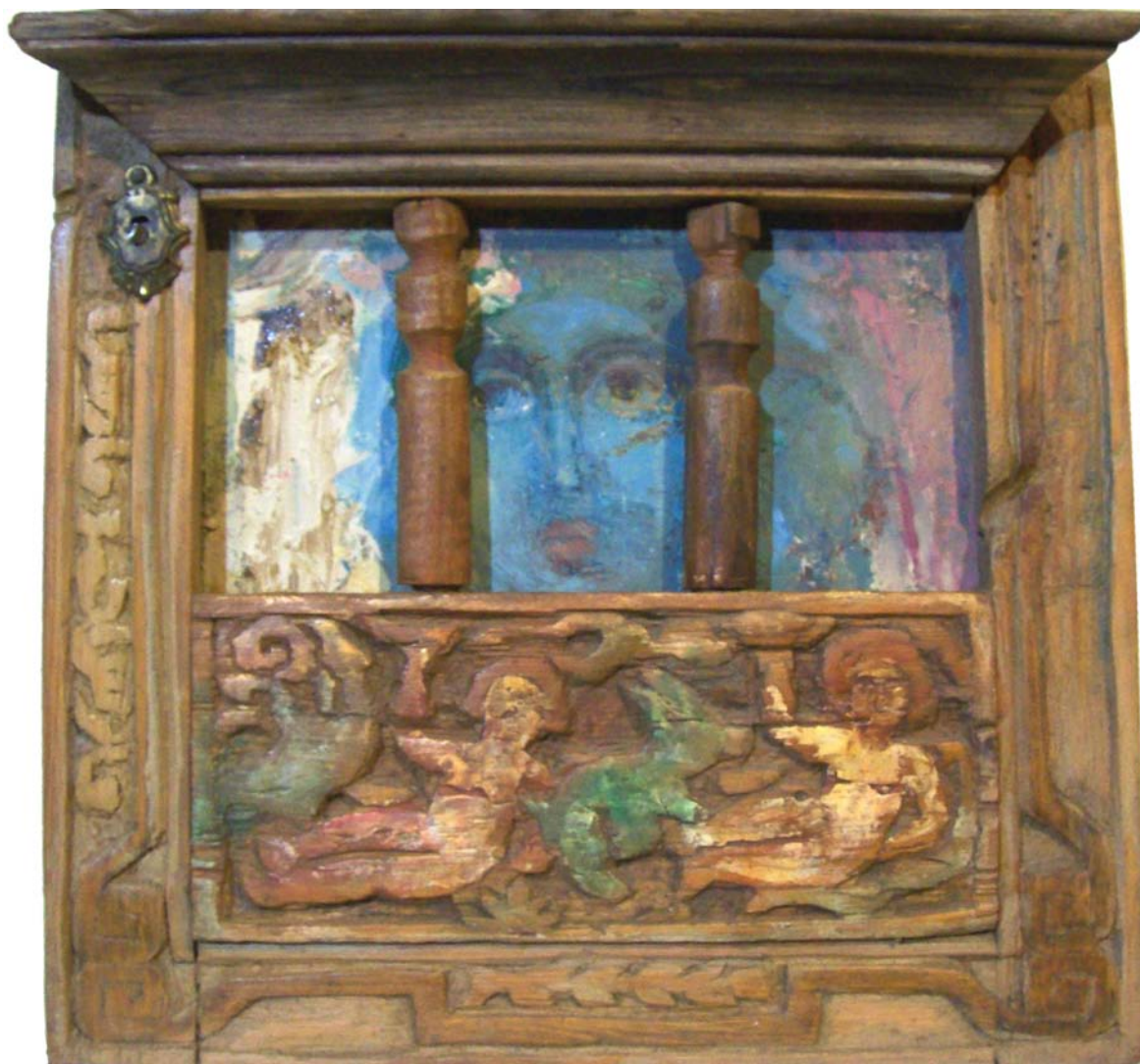
حفر ملون علی خشب - تصویر زيتي ۴۰X۴۰ سم