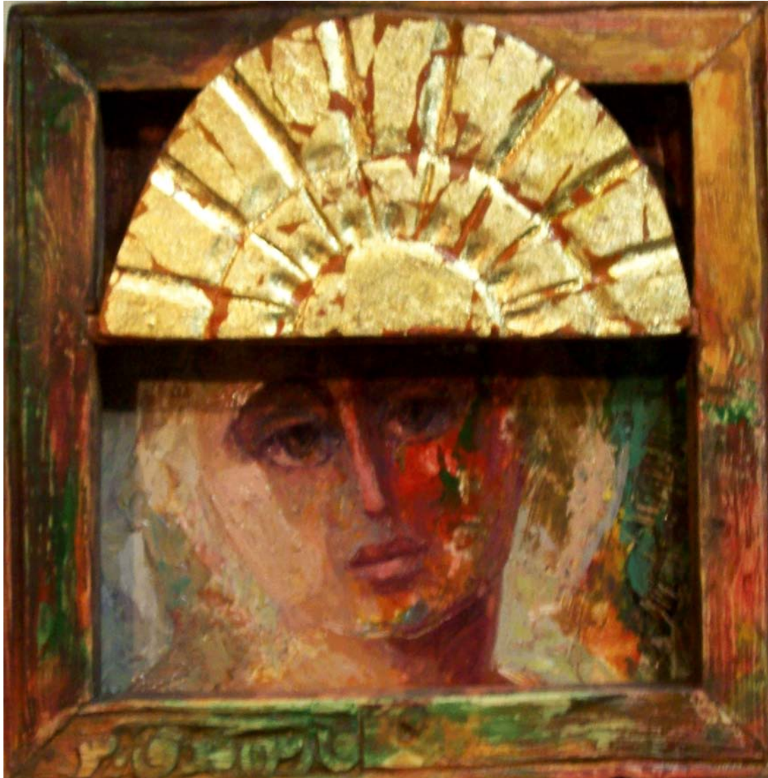
حفر ملون علی خشب - تصویر زیتنی - ۴۰×۴۰ سم