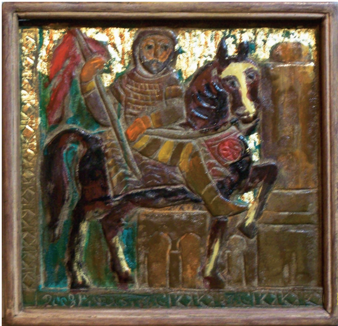
حفر ملون علی خشب - ۴۰ X ۴۰ سم