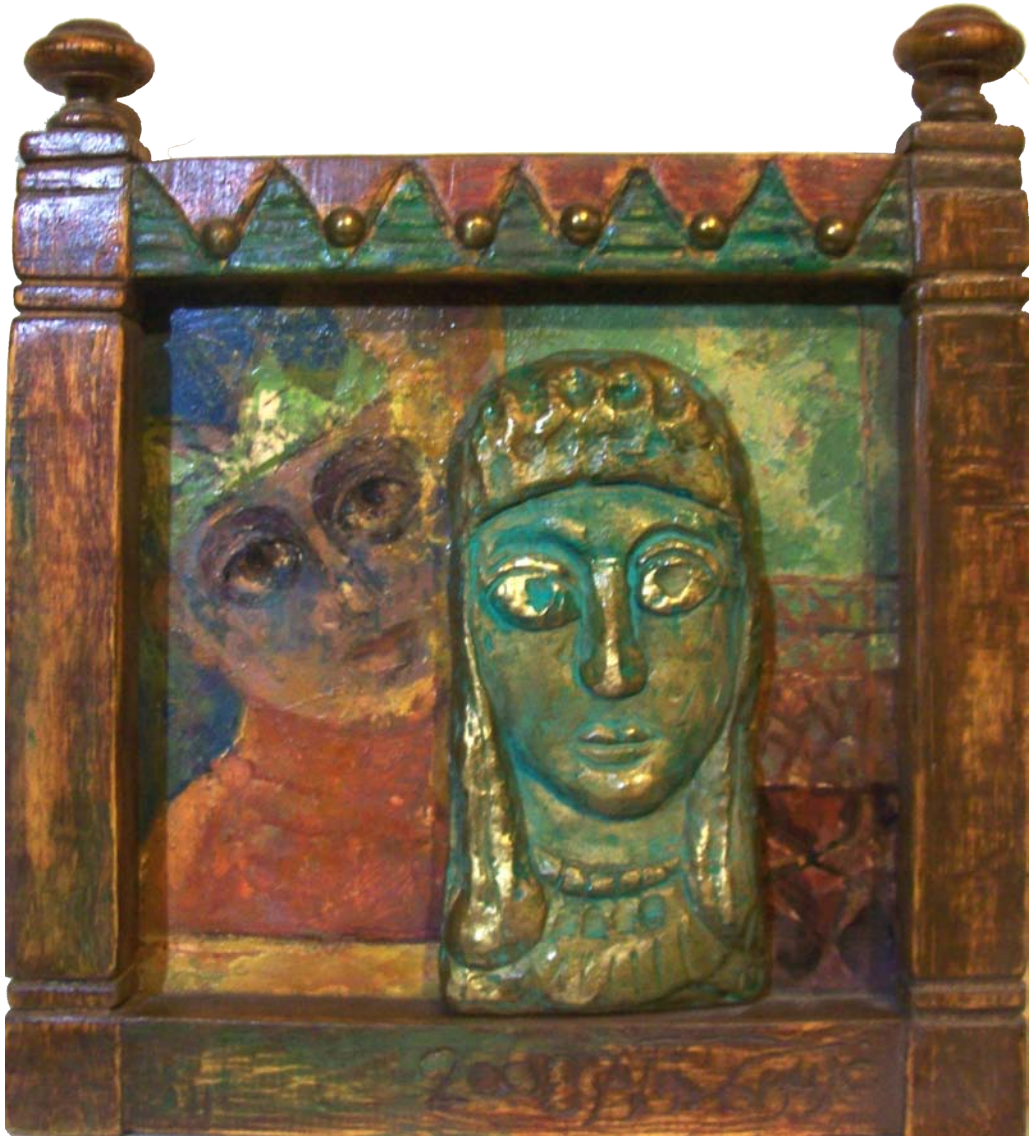
حفر ملون علی خشب - تصویر زیتي - ۴۰ X ۴۰ سم