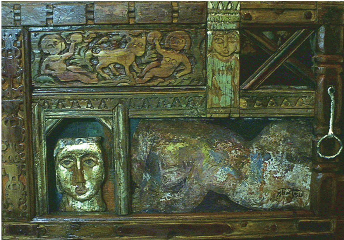
حفر ملون علی خشب - تصویر زیتي - ۶۰X۴۰ سم