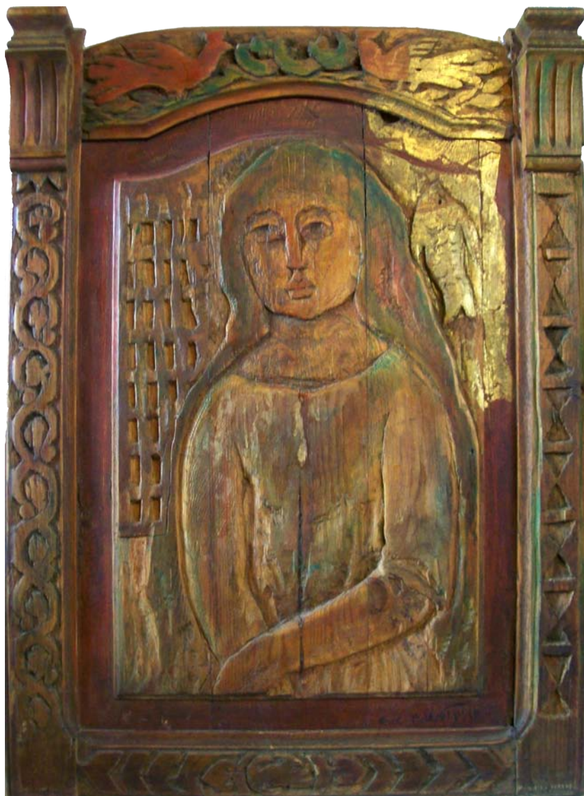
حفر ملون علی خشب - تصویر زيتي - ۶۰ X ۴۰ سم